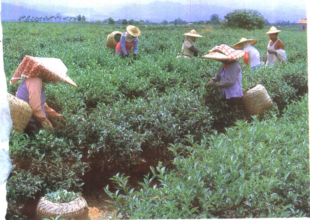
▲ 采茶的季节,茶姑娘们点缀在翠绿的茶园中。 选自《中国茶道》