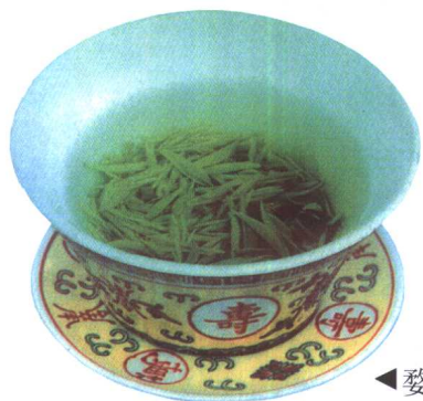
◀婺绿茗眉,汤色清幽,香气清高,滋味鲜醇。