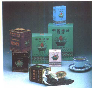
▲在国际茶叶评比会上获奖的各种中国茶 选自《中国——茶的故乡》