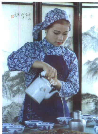
▼婺源茶艺:农家茶演示