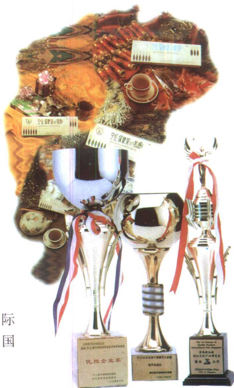
▶ 1993年荣获首届新加坡国际名优产品最高金奖和多次获得中国国家级金奖的宁红保健茶