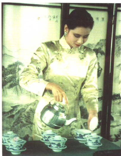
◀婺源茶艺:富士茶演示