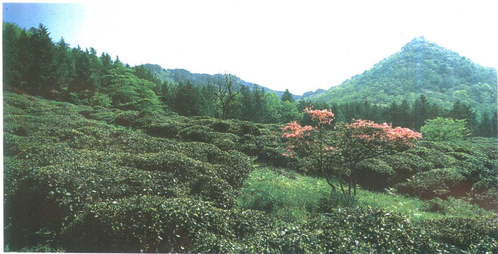
▲江西婺源茶园 选自《中国——茶的故乡》