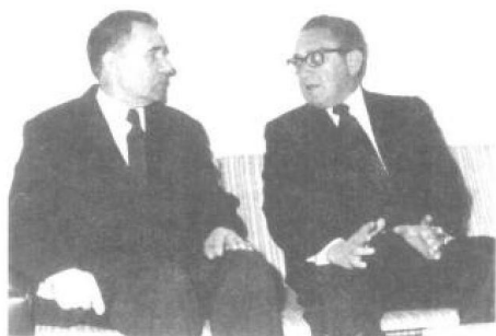
美国国务卿亨利·基辛格与前苏联外长安德烈·葛罗米柯在日内瓦举行会晤。