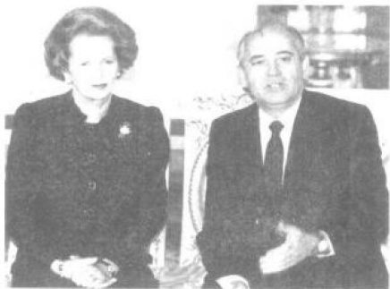
英国首相撒切尔夫人和前苏联领导人戈尔巴乔夫在1987年内两次会晤。