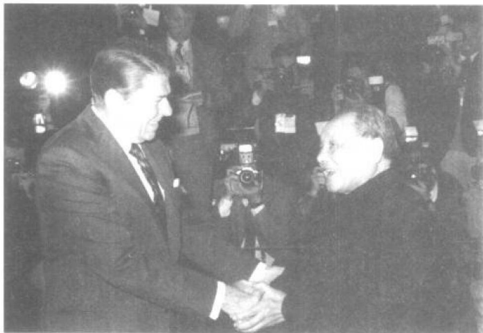
1984年4月28日，邓小平在北京会见来访的美国总统里根和夫人。