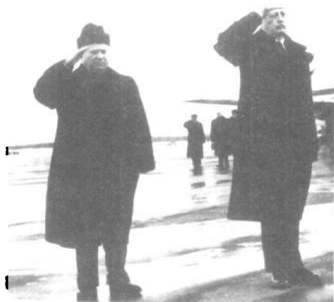
赫鲁晓夫到机场欢迎英国首相哈罗德·麦克米伦