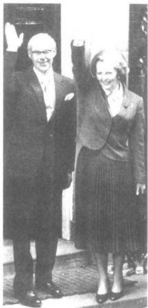
1979年5月3日，53岁的玛格丽特·撒切尔夫人成为英国历史上第一位女首相。