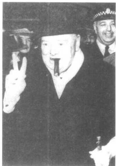
温斯顿·丘吉尔在英国竞选中获胜