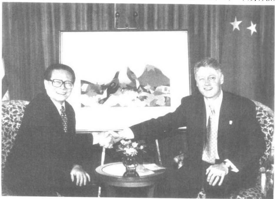
1997年11月26日，江泽民主席在温哥华会见美国总统克林顿。