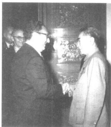
1973年2月15日，周恩来总理和美国国家安全事务助理亨利·基辛格博士举行了会谈。