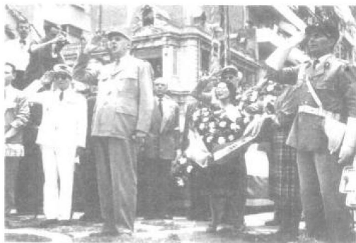
1946年6月1日，夏尔·戴高乐从皮埃尔·弗林姆手中接过了法国总理的职务。