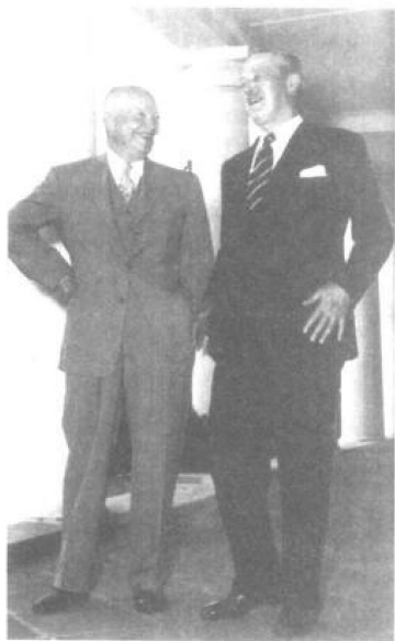
麦克米伦到了华盛顿哥伦比亚特区，向艾森豪威尔总统通报他的苏联之行。