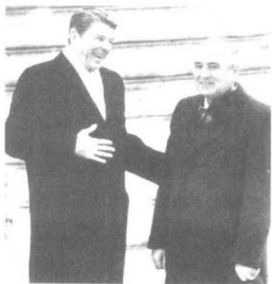
1985年11月19日，罗纳德·里根和米哈伊尔·戈尔巴乔夫初次在日内瓦会晤。