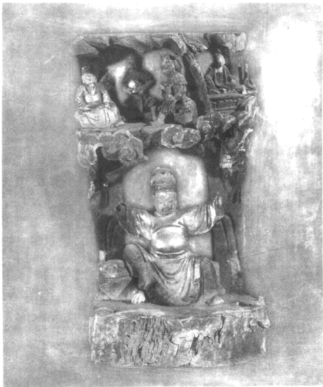
孙思邈坐虎灸龙雕像 上层自左至右为神农、伏羲、燧人、女娲 人命至重 有贵千金 一方济之 德踰于此