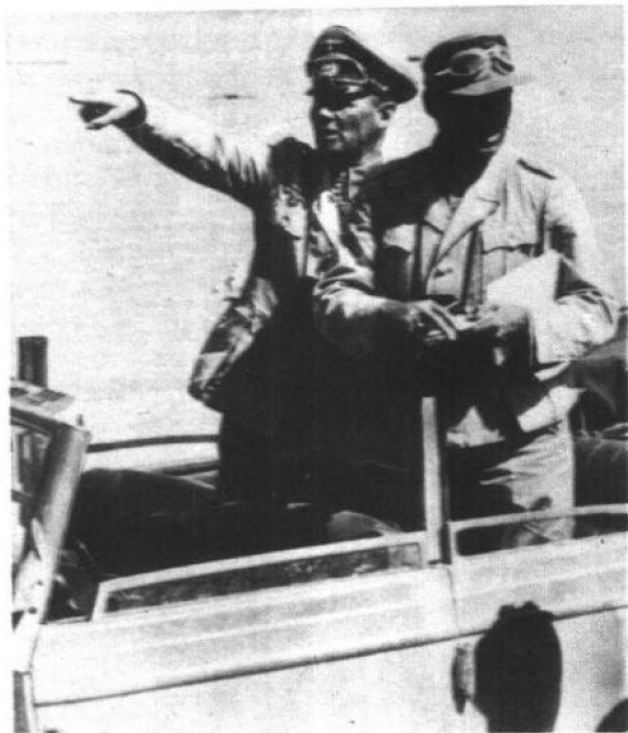
隆美尔在北非战 场指挥作战