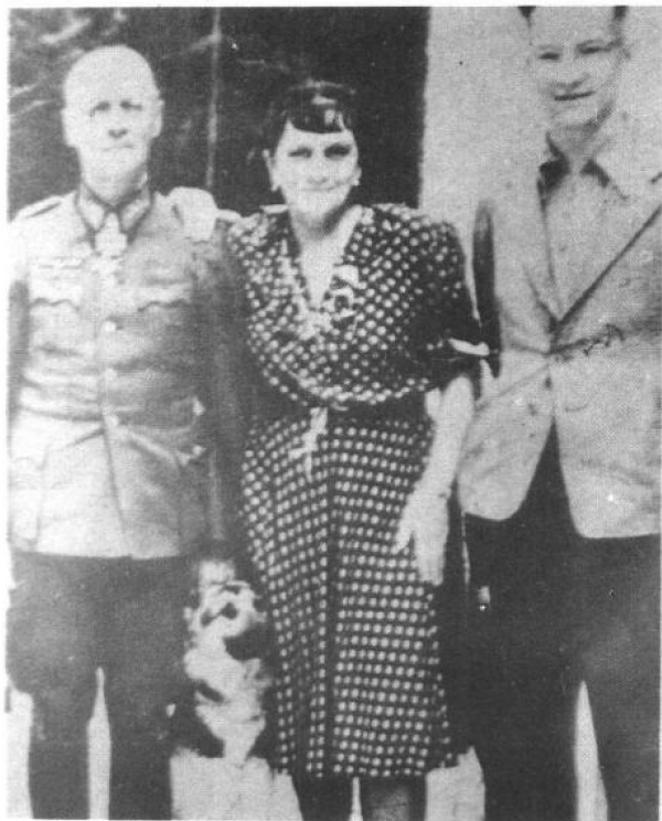
在盟军进攻诺曼底前夕，隆美尔与其子在赫林根为其夫人庆祝生日