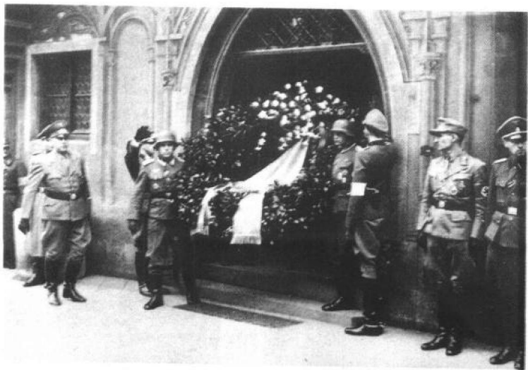
下图为隆美尔死后，希特勒送的花圈