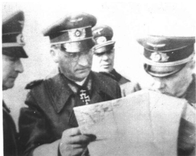
1944 年隆美尔 与 B 集团军群的同 僚们在研究作战计划