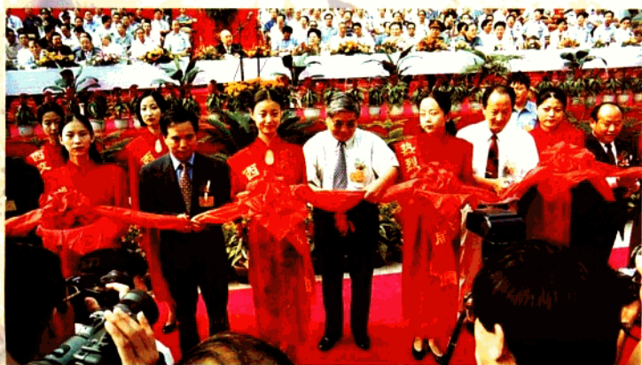
中共陕西省委书记李建国、省长程安东，中共宝鸡市委书记庞家钰等为盛会剪彩