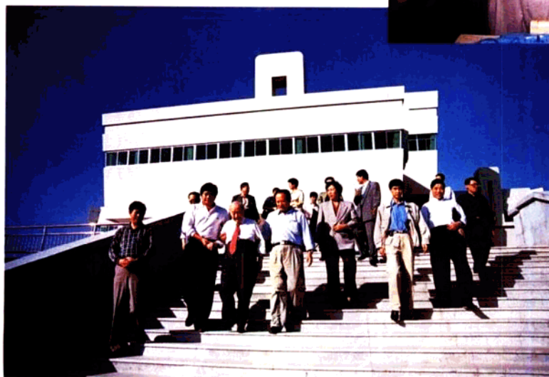
全国政协副主席、著名科学家钱伟长1998年9月来宝鸡调查文物保护工作