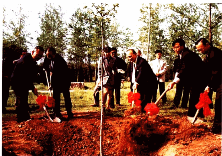
日本八幡市友好协会代表团1998年4月来宝鸡访问。图为两市领导人一起栽植友谊树