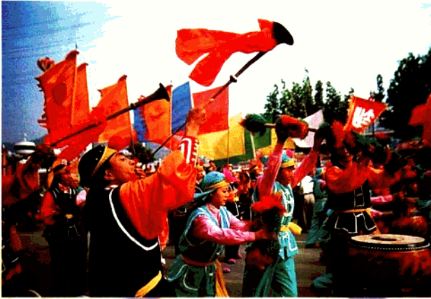
西交会开幕式大型广场民间艺术演出