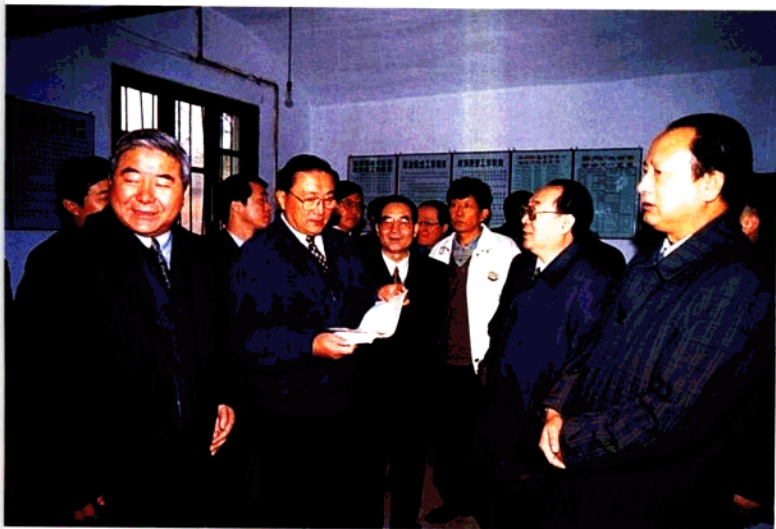
中共中央政治局委员、书记处书记、中央政法委书记罗干1998年11月来宝鸡视察农村综合治理工作