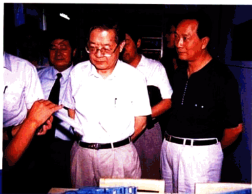
全国人大常委会副委员长周光召1998年9月视察宝鸡高新技术产业开发区