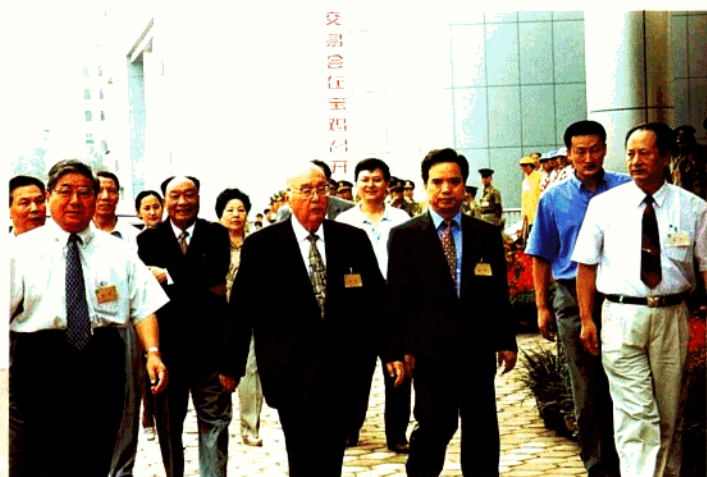
全国人大常委会副委员长王光英在省、市领导陪同下出席西交会开幕式