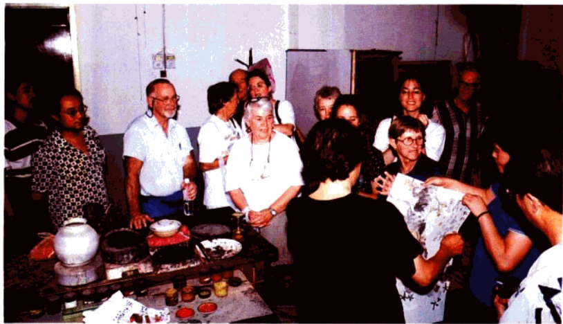
美国环球志愿者服务队一行13人1998年7月来宝鸡考察民间艺术等。图为美国客人接受宝鸡群众艺术馆画家赠送的国画