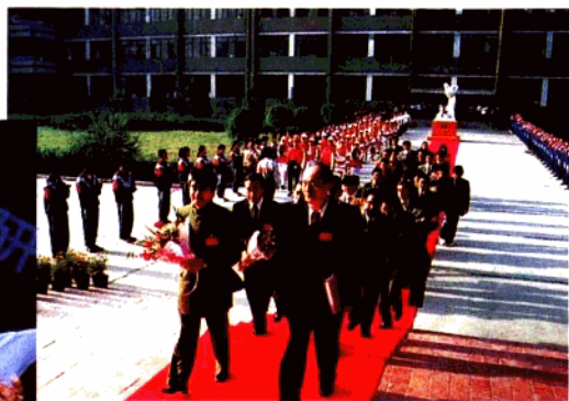
中日生命能科学国际学术研讨会1998年9月在宝鸡召开。图为中日双方代表步入会场