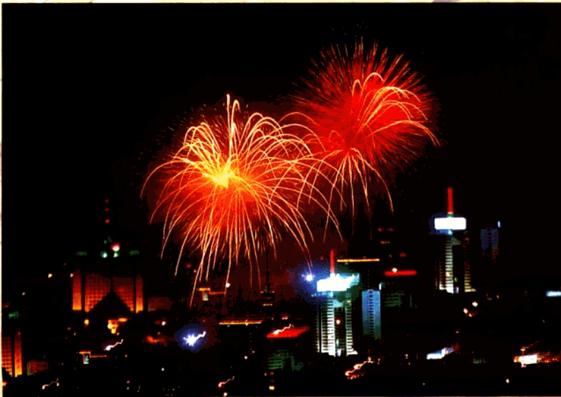
西交会大型焰火晚会