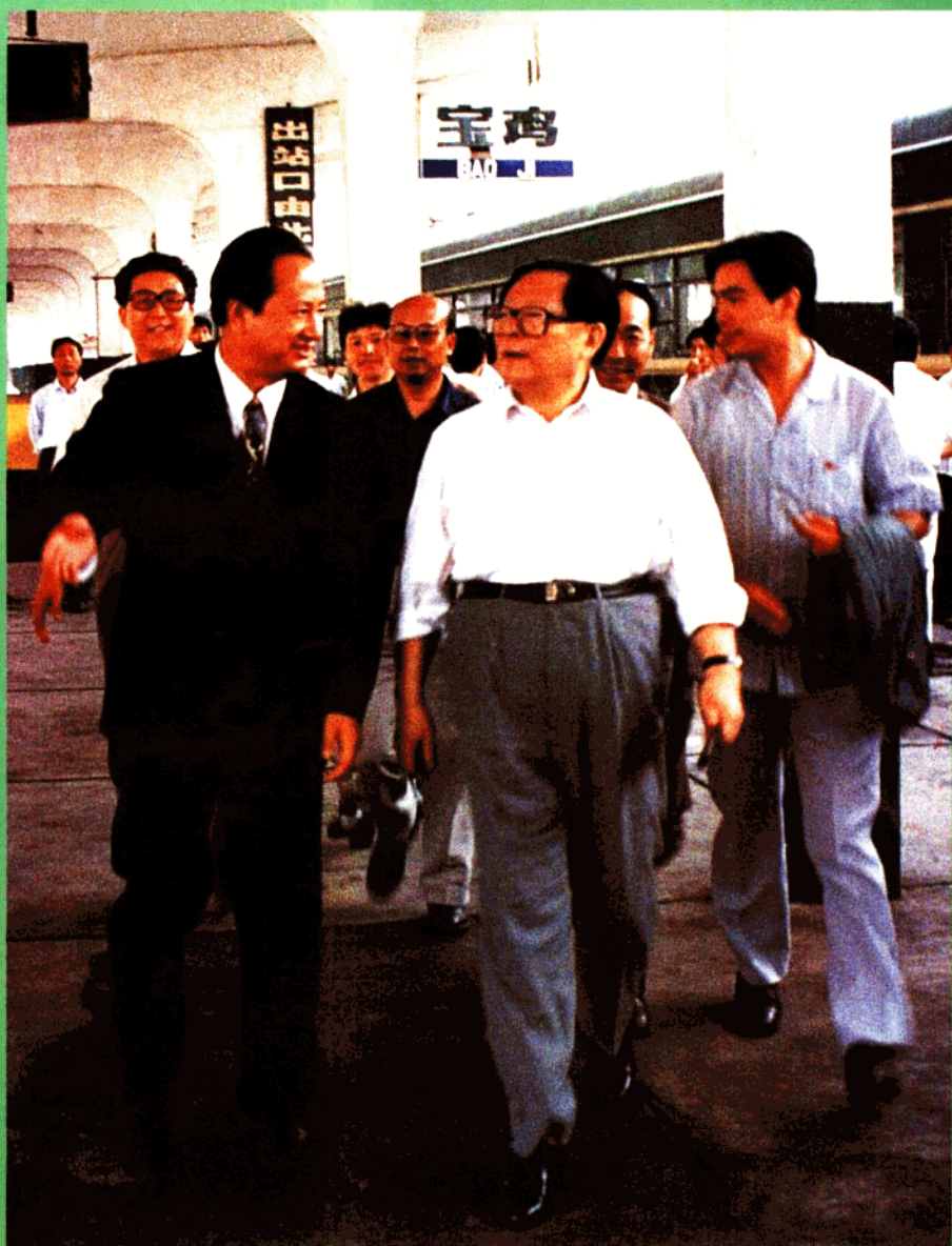
中共中央总书记、国家主席、中央军委主席 江泽民1993年6月来宝鸡视察，中共宝鸡市 委副书记、市长庞家钰等在宝鸡火车站迎接