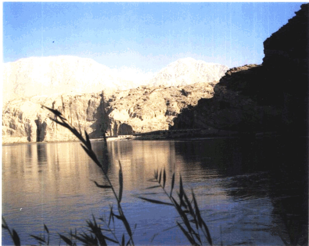
1 库木吐喇石窟群远眺