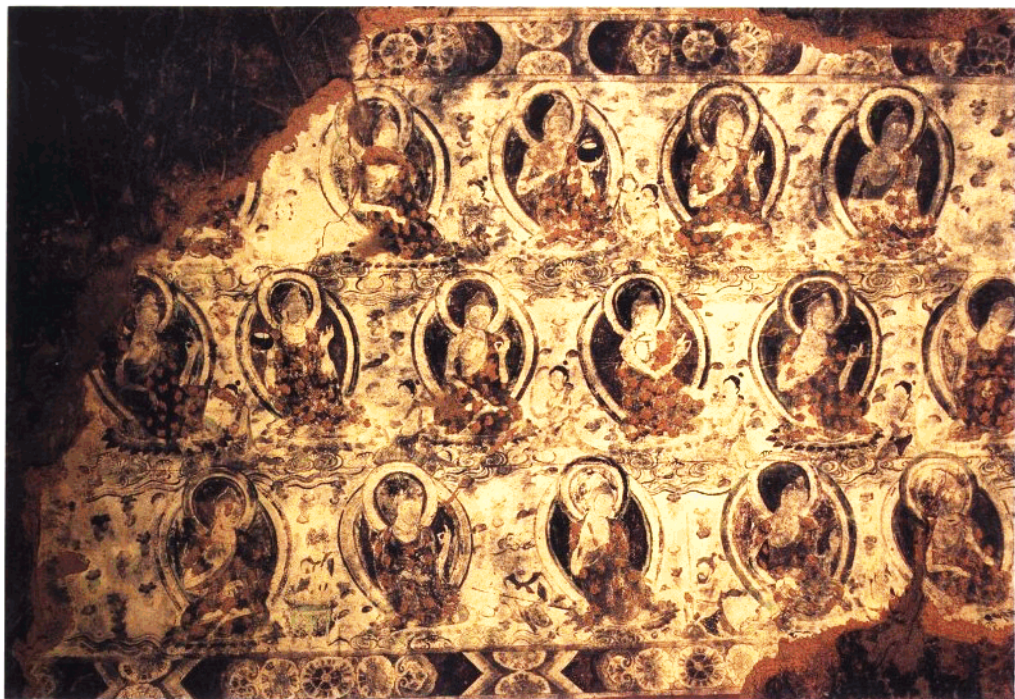
9 第10窟 主室券顶南侧壁 坐佛局部