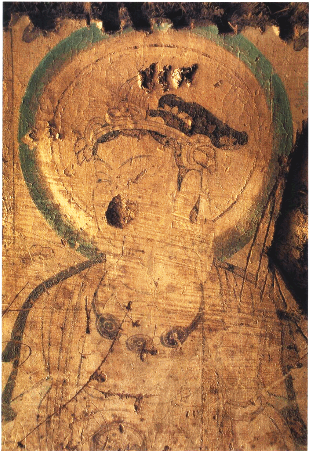
15 第12窟 北甬道外侧壁 供养菩萨像特写