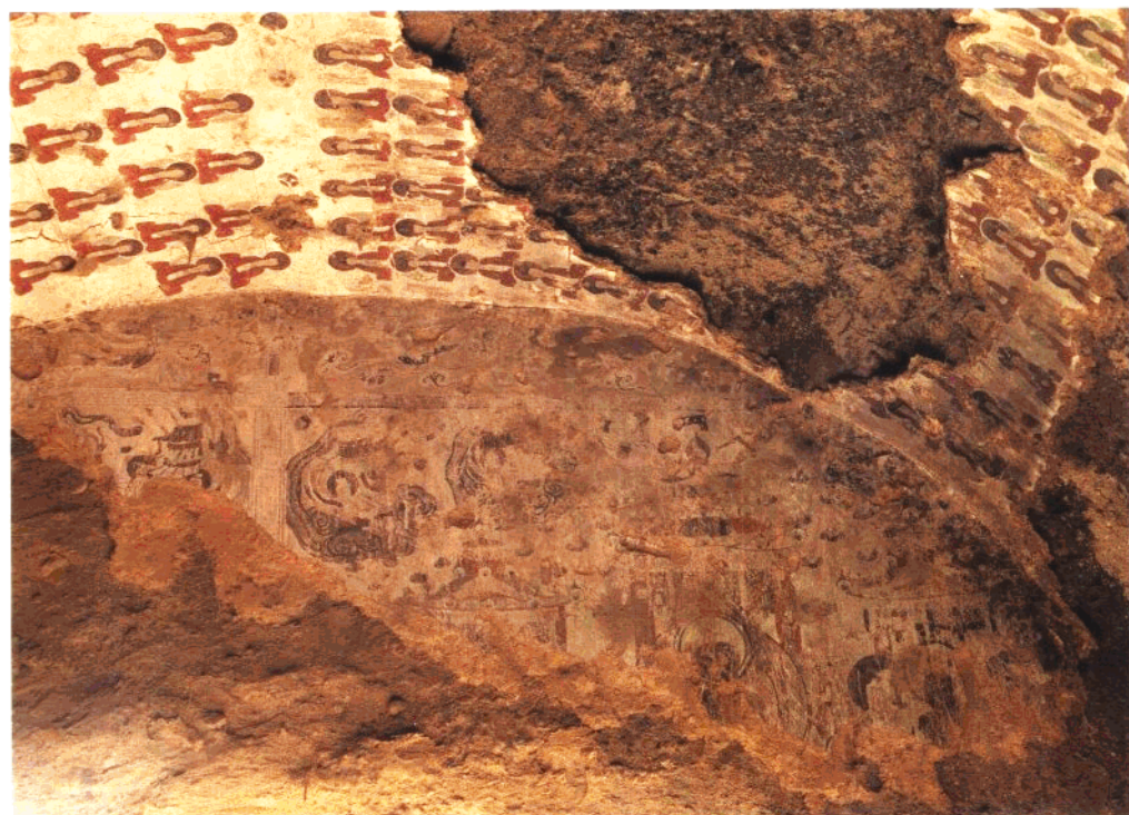
12 第11窟 主室前壁入口上方圆拱壁残部