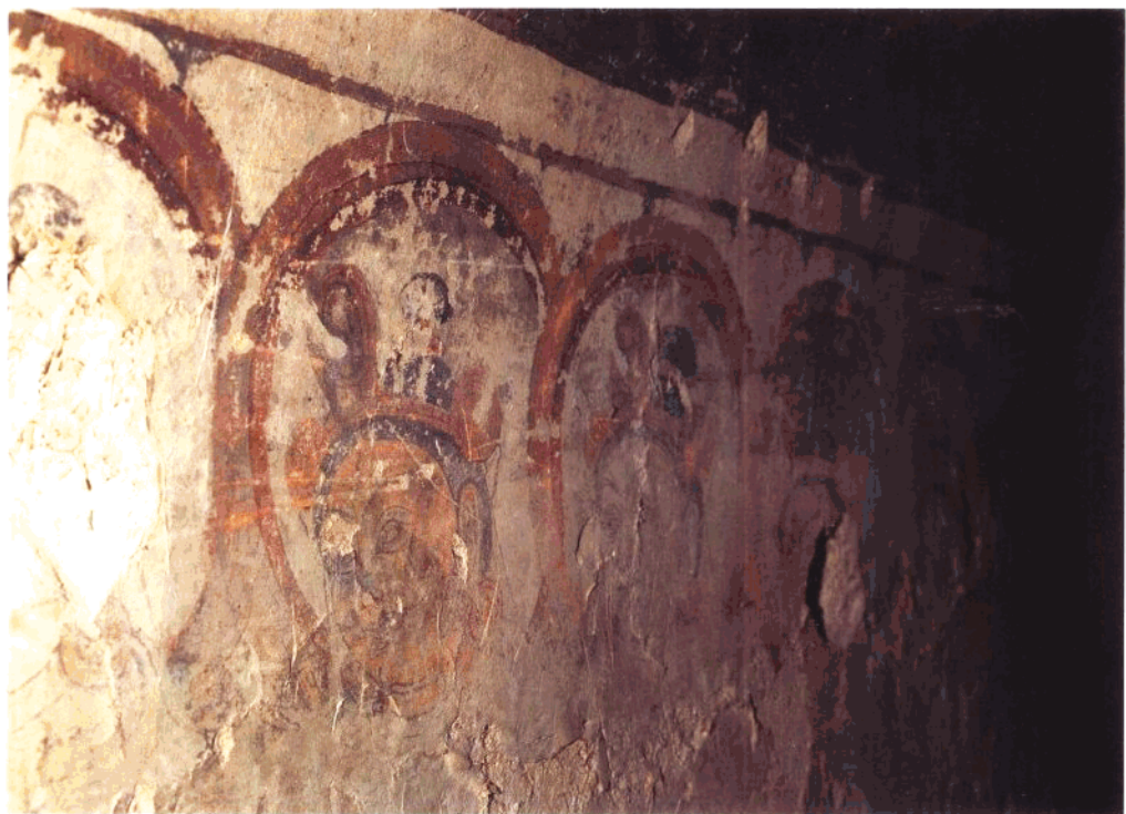
8 第10窟 后甬道前壁 举哀天人特写