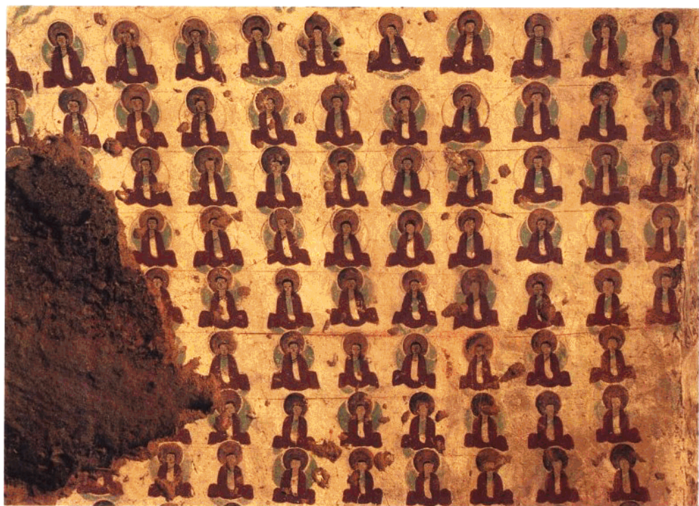
14 第11窟 主室券顶南侧壁 千佛局部