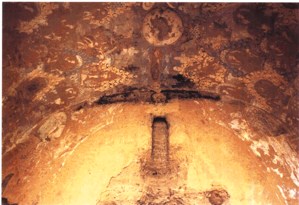
3 第2窟 主室正壁及券顶局部