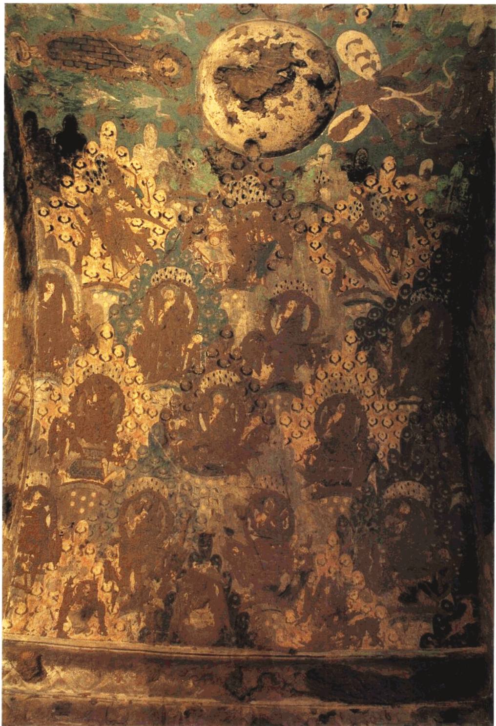
5 第2窟 主室券顶东侧壁 菱形格壁画