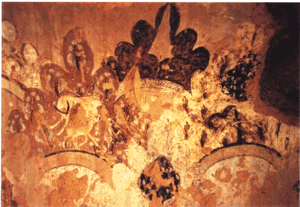
7 第2窟 后甬道正壁 菱形格壁画局部