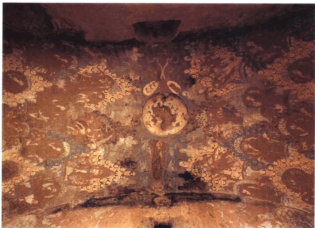
4 第2窟 主室券顶壁画全景