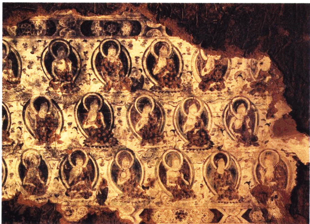
10 第10窟 主室券顶北侧壁 坐佛局部