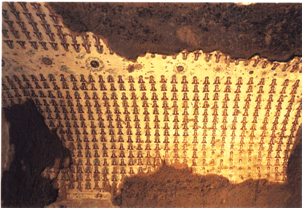
13 第11窟 主室券顶南侧壁 千佛