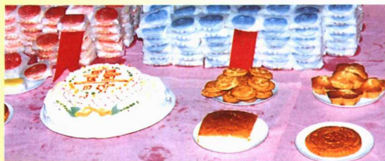
▲副食品加工厂生产的部分糕点产品