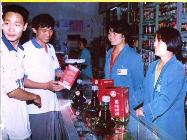
▼下属门市部正在销售本县生产的葛根补酒

富源县商业贸易总公司，系 1995 年机构改革时，由行政性质的商业局改为经济实体并更名而得。1995 年底，下属 2 个工厂，7 个公司，有干部职工 860 人。在市场疲软的情况下，通过广大干部职工的努力，1995 年完成商品购进总值 5346.6 万元，完成商品销售额 5580 万元。该公司系国有企业，资金雄厚，讲求信誉，欢迎客户洽谈商务。