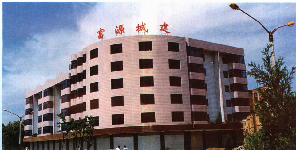
▲1995年兴建,1996年竣工的综合楼。