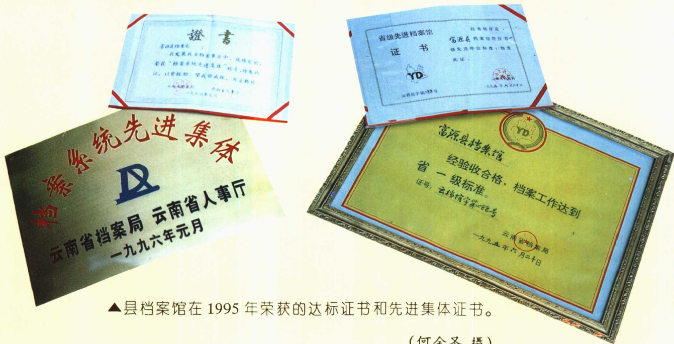
▲县档案馆在1995年荣获的达标证书和先进集体证书。