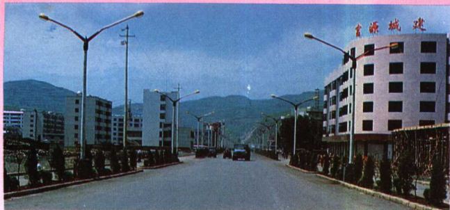
▲1994年动工兴建,1996年竣工的胜境大街,全长5.1公里,总投资2500万元。