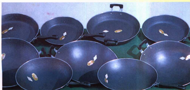
▼县铸锅厂生产的富源牌铁锅