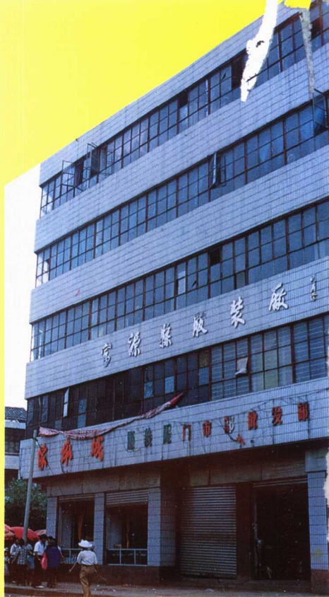
▲县服装厂的综合楼