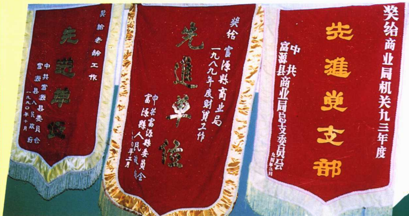
▲曾荣获的部分锦旗