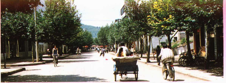
▲八十年代初兴建的兴源街