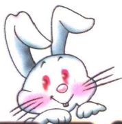
图 文 本