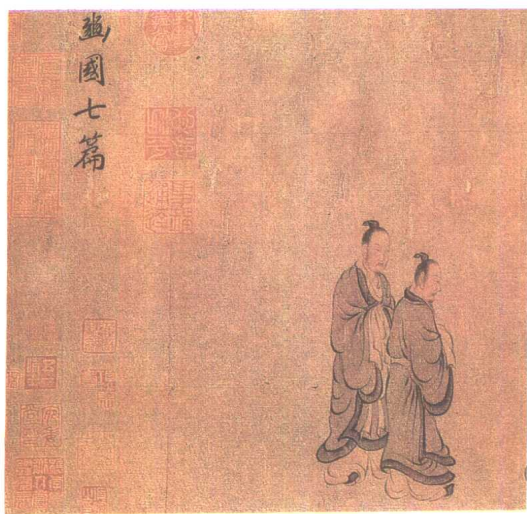
豳風圖·狼跋(局部) [宋] 馬和之