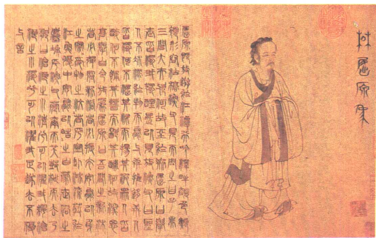
九歌图·屈原像 [元] 张渥