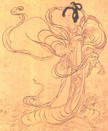
九歌图·湘君 [元]张渥

湘夫人 帝子降 木華下 菡萏出 未取言 中既言 菡萏出 帝子降 木華下 菡萏出 未取言 中既言 菡萏出