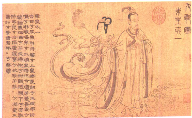
九歌图·东皇太一 [元] 张渥