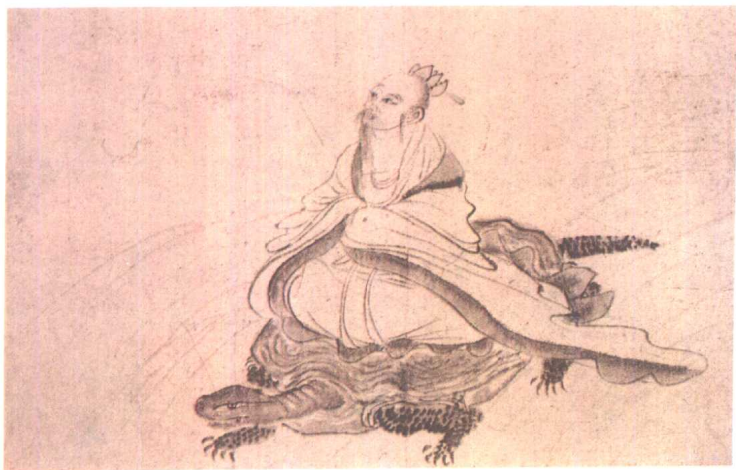
九歌图卷·河伯 [明] 杜堇