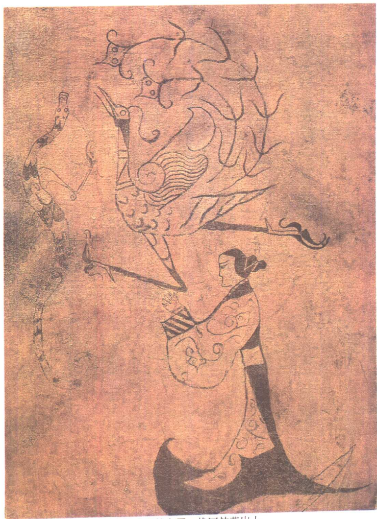
帛画龙凤仕女图 战国楚墓出土