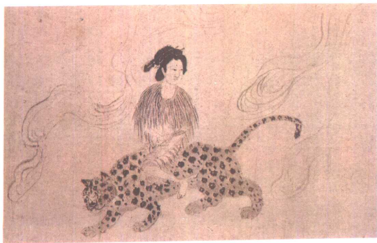
九歌图卷·山鬼 [明] 杜堇