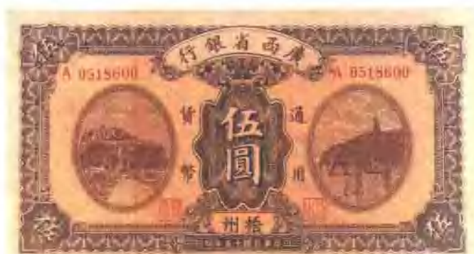
广西省银行通用货币伍元券(民国四年)。