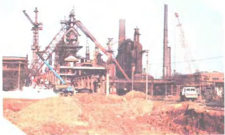
工商银行广西分行 通过柳州分行向柳州钢铁厂 发放贷款4.4亿元 (1987-1992年),支持 该厂进行技术改造。因 为该厂的二号炼铁高炉。