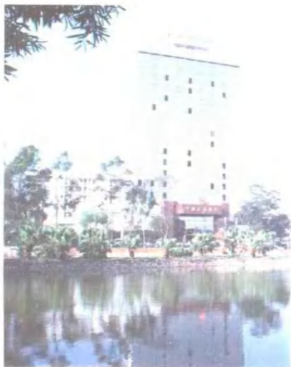
中国工商银行广西壮 族自治区分行 地址：南宁市桃源路 88 号