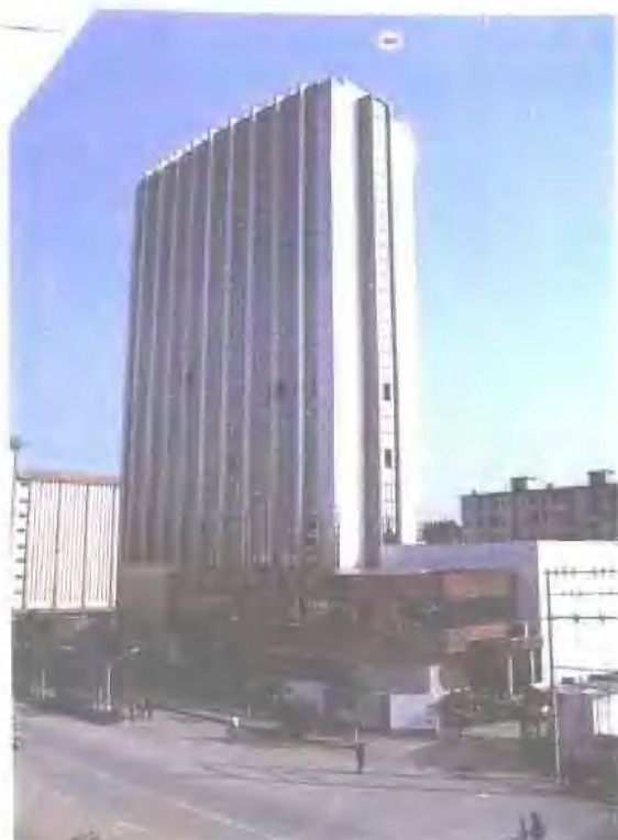
南宁大学财经学院。 地址：南宁市延平路14号