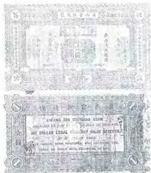
广西官银钱号纸币壹元券(光绪二十年)。