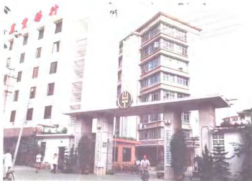
中国农业银行广西壮 族自治区分行 地址：南宁市天桃路 27 号