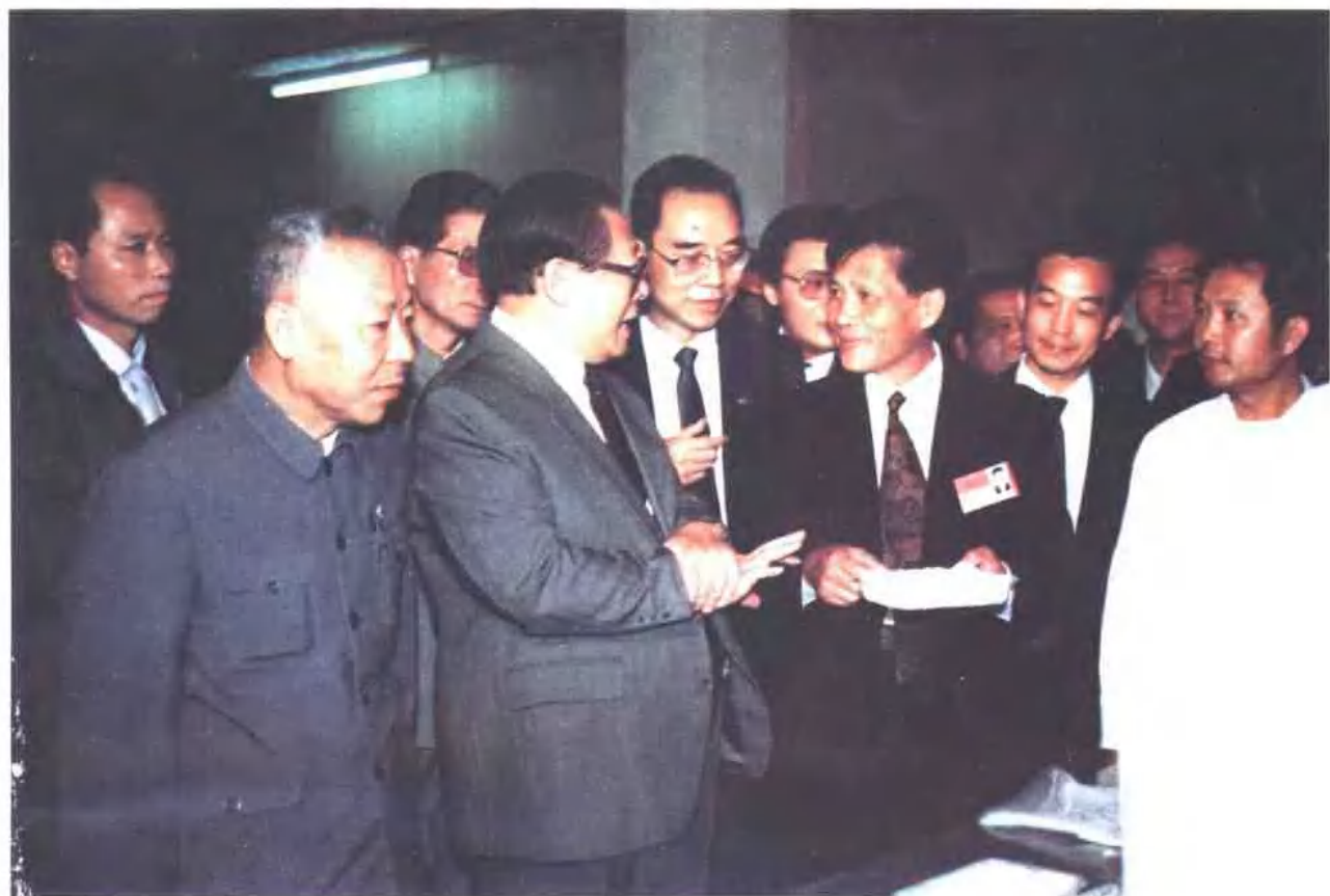
1990年11月江泽民总书记(前左二)在自治区党委书记赵富林(前左一)陪同下,到中国银行南宁分行贷款扶持的企业——北海太平洋冷冻厂视察。