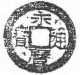
明朝在广西铸造的大中通宝(背“桂一”)、永历通宝(背“五厘”)。