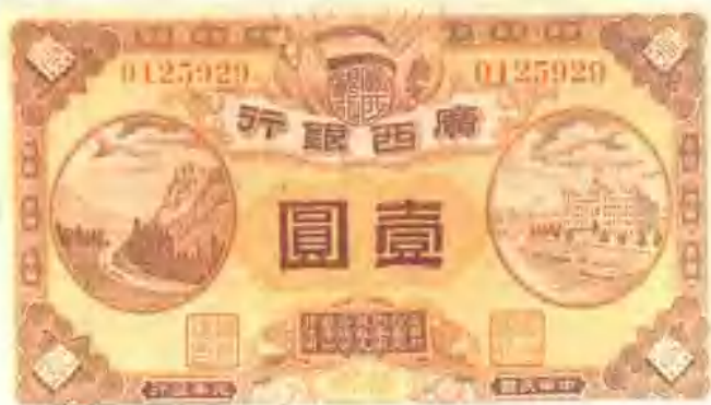
广西银行纸币壹元券(民国元年)。