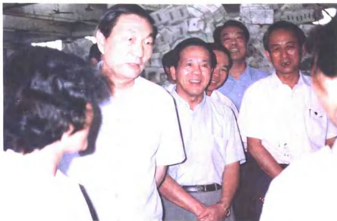
1994年7月国务院副总理兼中国人民银行行长朱镕基(左二)在自治区主席成克杰(左三)陪同下在广西视察洪水灾情及金融工作。