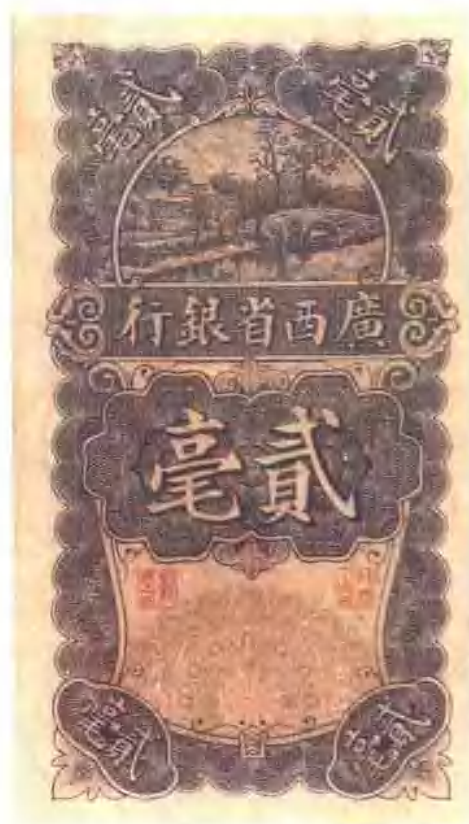
广西省银行纸币貳毫券。