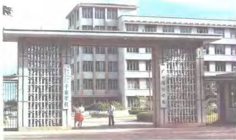
广西财经学院。 地址：南宁市桃源路