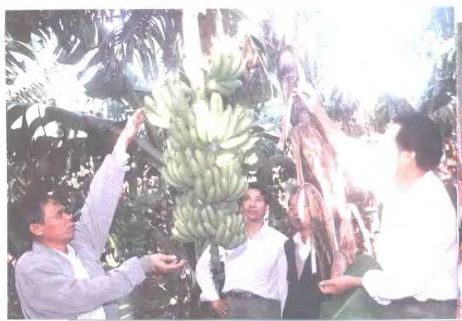
农村信用社贷款支 持农民发展多种经营。