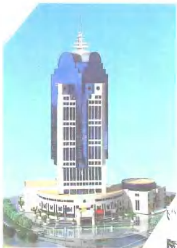
广西信托投资公司(模型)。 地址：南宁市桃源路