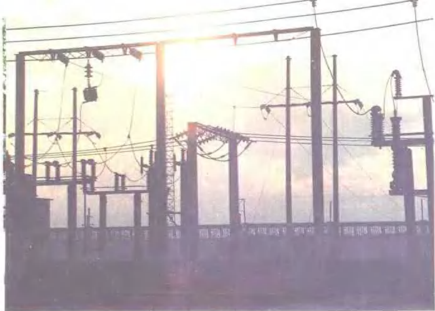
农业银行贷款支持 发展农村电力工业。