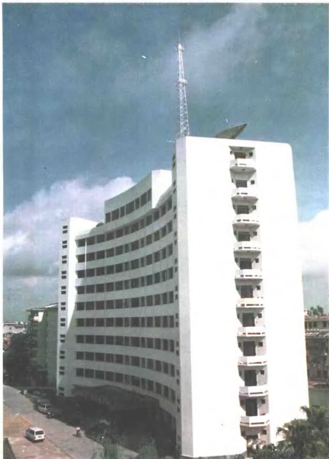
中国人民银行广西壮族自治区分行、国家外汇管理局广西分局。