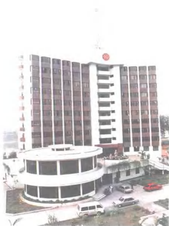
中国人民建设银行广 西壮族自治区分行 地址：南宁市桃源路 82 号