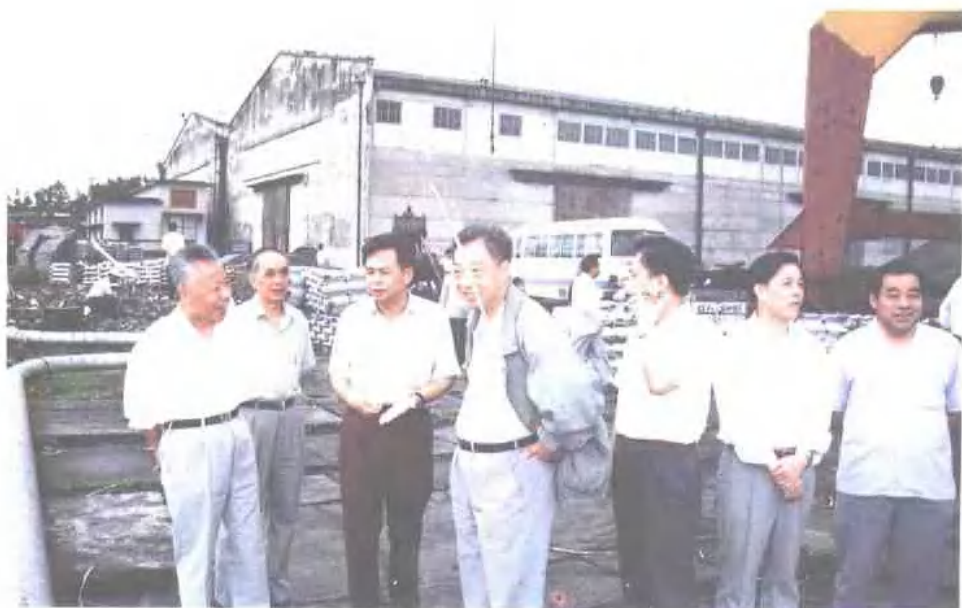
以中国人民银行总行副行长郭振乾为组长的国务院工作组一行9人于1993年5月到广西检查社会集资、投资和金融工作。(左一为赵富林、左二为李明初,左四为郭振乾)