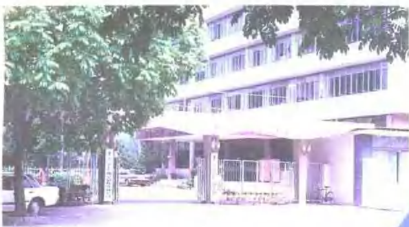
中国银行南宁分行。 地址：南宁市方城路16号