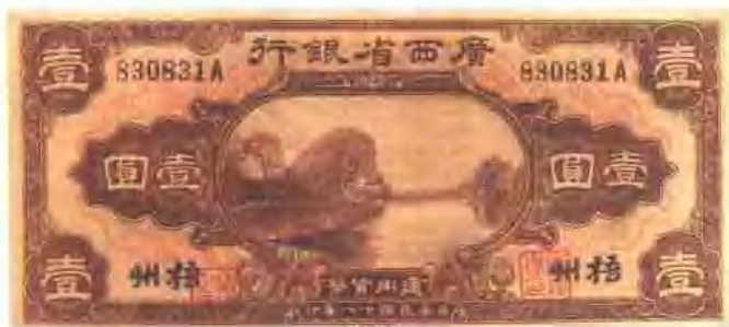
广西省银行通用货币壹元券(民国八年)。