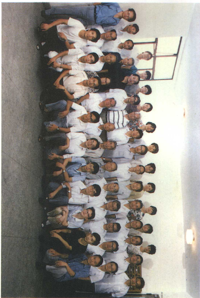
华东师范大学哲学系全体教师(1988年) 第二排右第七人为作者