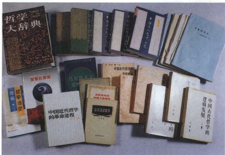
作者部分编著书影