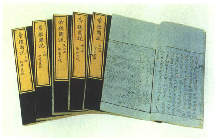
张居正为神宗皇帝编著的《帝鉴图说》