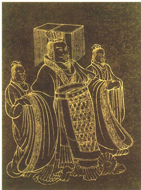
汉武帝刘彻像(公元前156—前87年)