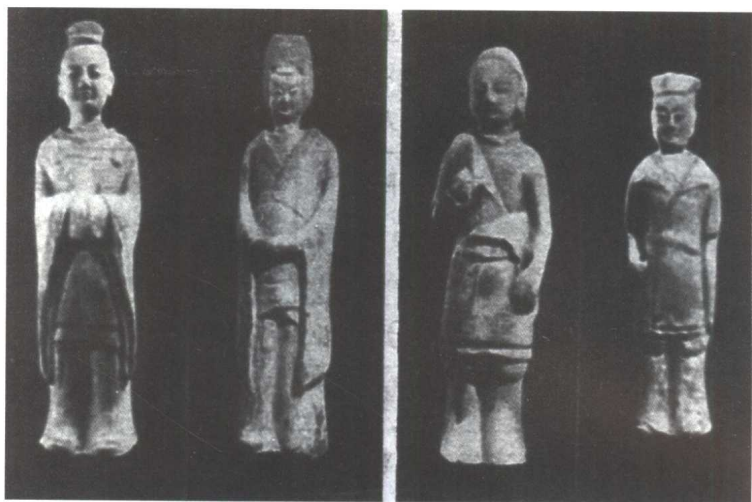
北魏胡服俑与汉服俑(河北景县封氏墓出土)