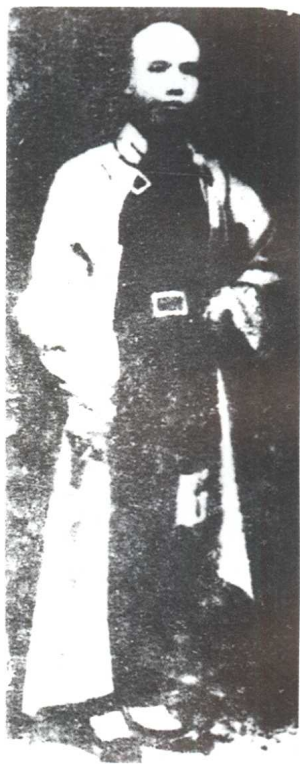
谭嗣同像(公元 1865—1898 年)