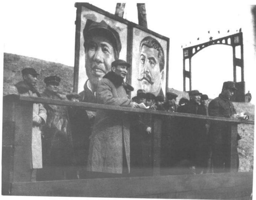
1948年9月，陈云在吉林省陶赖昭松花江大桥通车典礼上讲话。