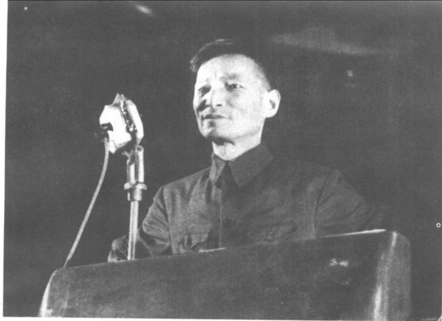
1948年8月3日、4日，陈云在第六次全国劳动大会上作题为《当前中国职工运动总任务》的报告。