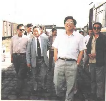
1993年7月铁道部长 韩杼滨(右2)检查满洲里 站联运工作