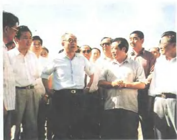
1993年7月国务院副总理 邹家华视察海拉尔铁路分局