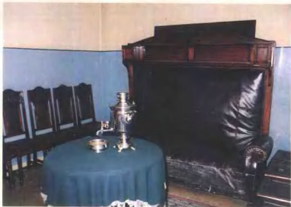
毛泽东主席在满洲里站转乘前休息的车站贵宾室