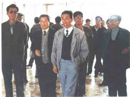
哈尔滨铁路局长宫树清（左3） 在博克图地区检查工作