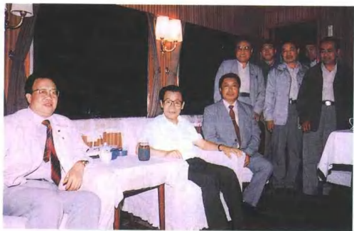
1992年8月全国政协主席李瑞环视察海拉尔铁路分局