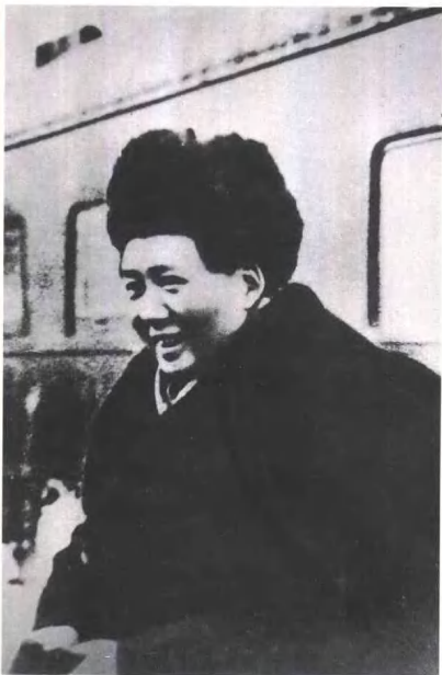
1950年2月26日毛泽东主席出访苏联从满洲里进抵返京