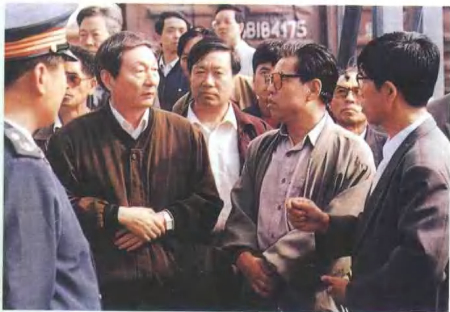
1993年8月国务院副总理朱鎔基视察满洲里口岸铁路运输