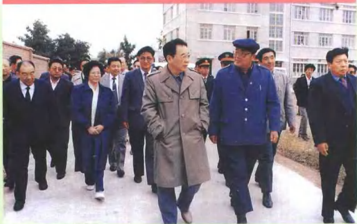
1989年9月国务院总理李鹏视察满洲里口岸铁路运输