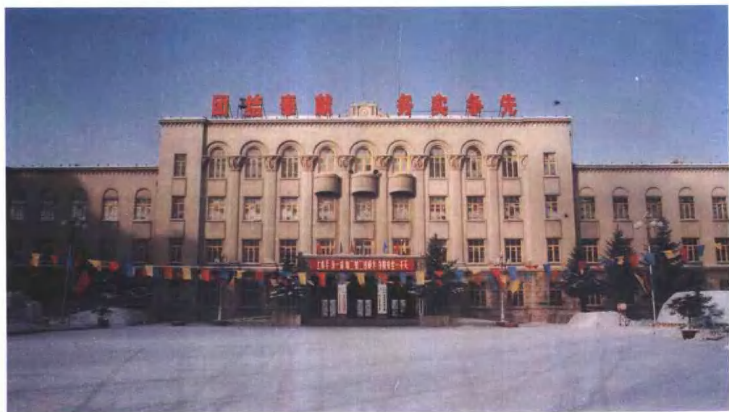
海拉尔铁路分局机关办公楼（一）