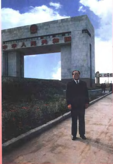
1990年9月中共中央总书记江泽民在铁路口岸国门前