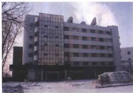
海拉尔铁路分局机关办公楼（二）