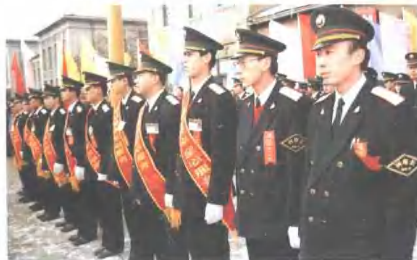
海拉尔列车段青年文明号命名仪式