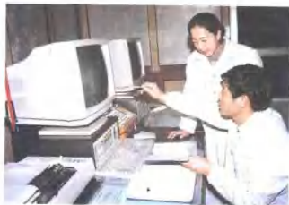
分局红外线探测(轴温)中心