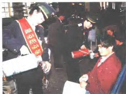
候车室为旅客服务