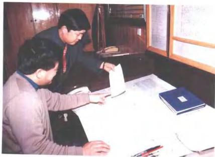
分局调度指挥行车