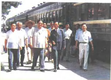
1986年6月原铁道部长 陈璞如(前排左2)视察满洲 里国境站