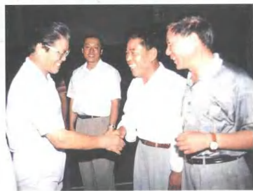
1996年7月中共中央政治局 委员李铁映来海拉尔铁路分局