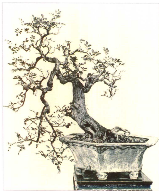
斜月帘栊 九里香 孔泰初