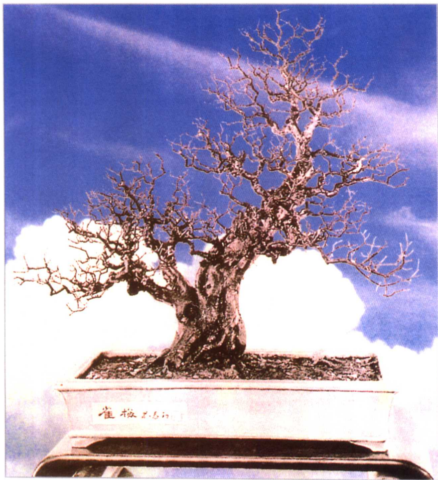
春复春 雀梅 孔泰初