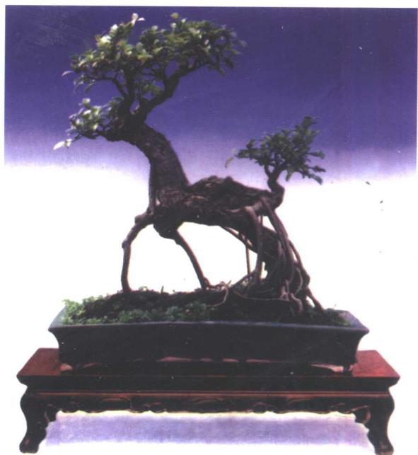
鹿鸣 榕树 林启旭