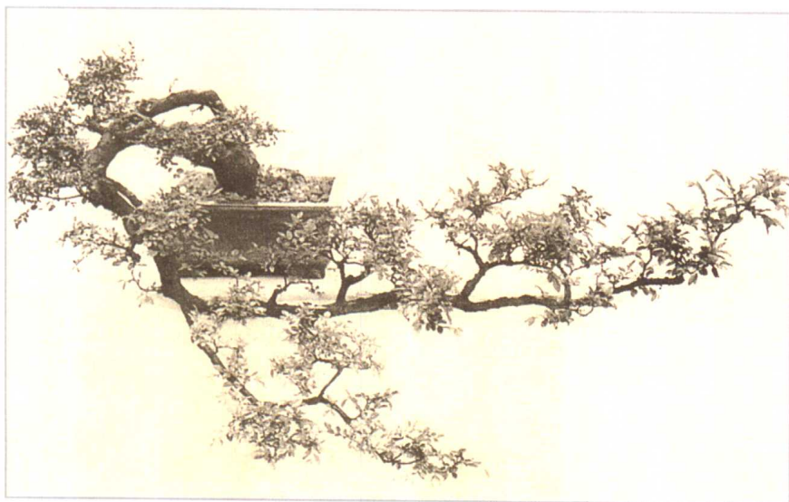
海底捞月 榆树 孔泰初