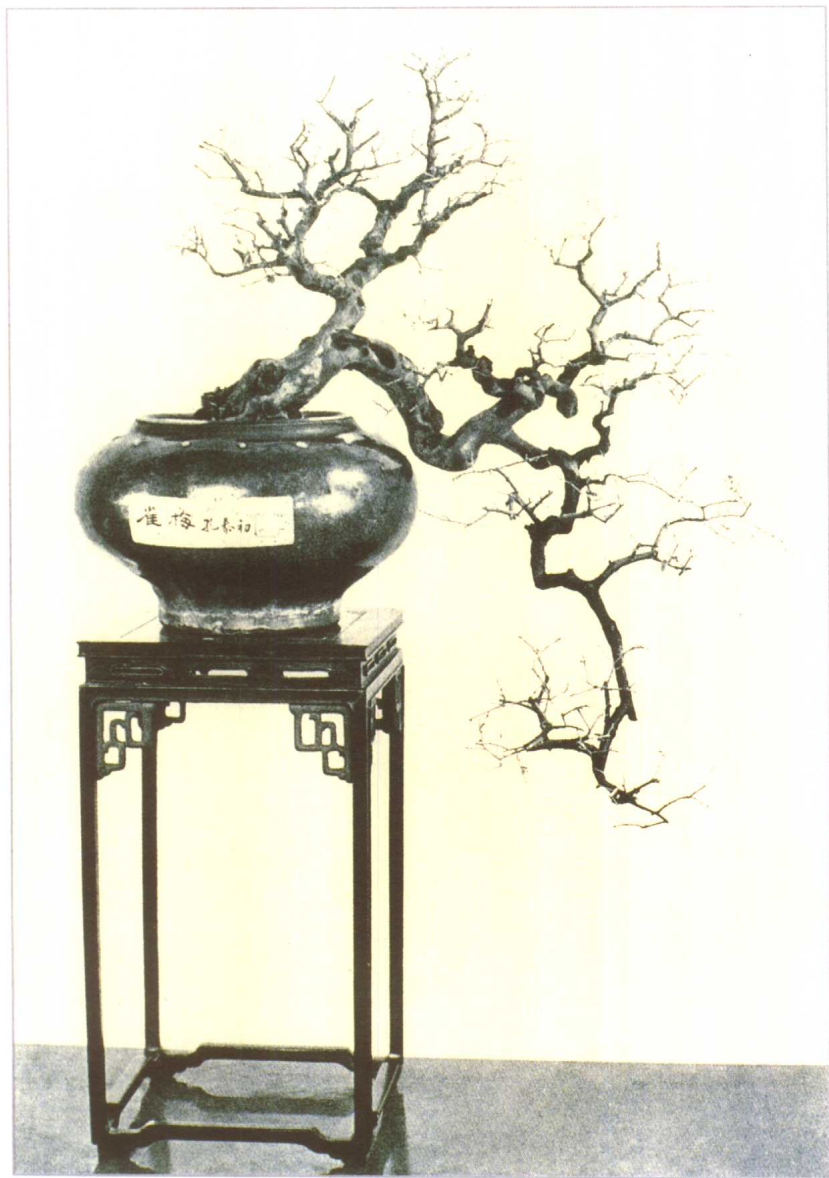
悬 雀梅 孔泰初