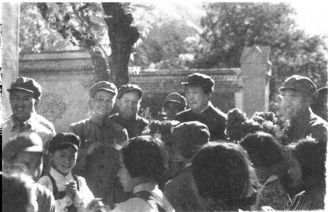
1949年5月，毛泽东和朱德会见出席中华全国青年第一次代表大会代表时，接受儿童献花。左二为冯文彬，左三为廖承志。