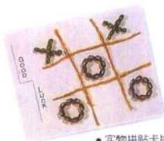
● 实物拼贴卡片。则通”这句话对卡片制作者来说可是一句受用不尽的话。但也

也许你会有一个疑问，那就是该怎么变，才变的通呢？其实一点都不难，只要把握住卡片的制作是有限制、没有规则的道理即可。也就是说环顾四周，事事皆可做为卡片的表现题材、物物皆可成为卡片的取材，如此一来不但题材、取材永不匮乏，创作出的卡片更是千变万化、目不暇给。