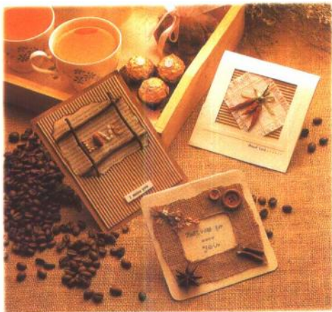
● 生活化的取材、巧思的运用，再配合上轻松的美术技法，最后再小心的修饰必能做出张张精美动人的卡片。

或许你会说不知道什么技法，小时候也没玩过什么，所以不知如何运用起！其实只要多用点心你就可以豁然开朗了。如果你现在还不甚明白，不妨先看看本书中创意派卡片的制作方式，相信你会想起一些私房小技法。