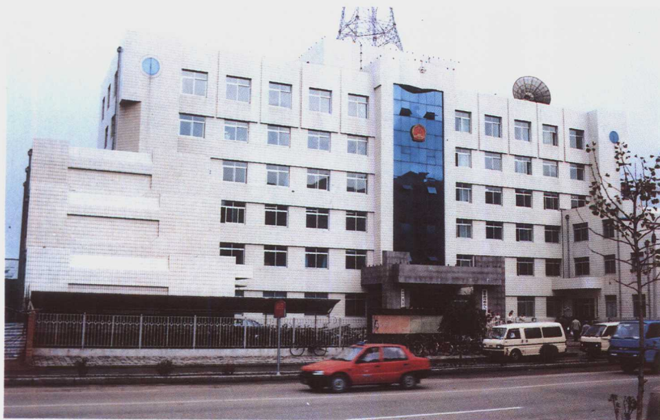
1993年7月落 成的丹东市人民检 察院办公楼