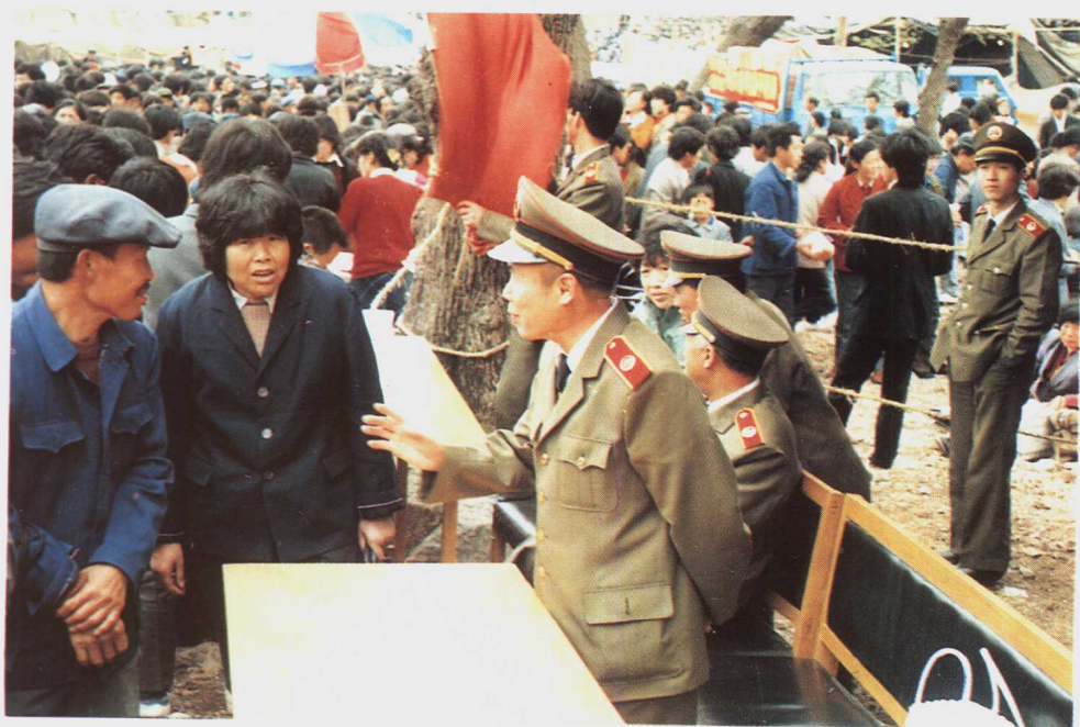
东沟县人民检 察院检察人员1985 年在农村集市接待 群众来访