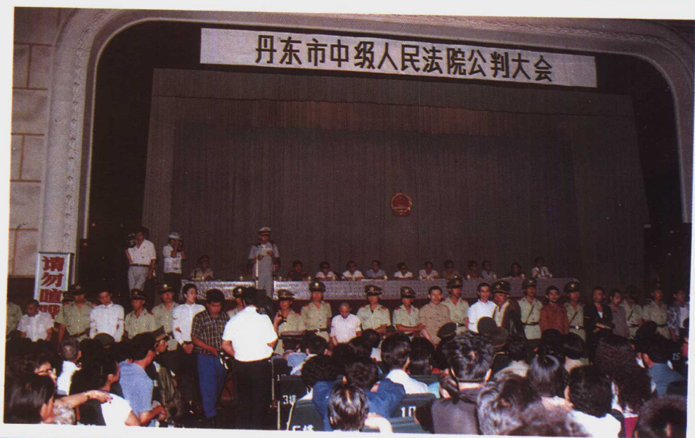
右下：在铁路 文化宫召开的公 判大会 (1985年9月)