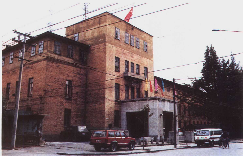
今丹东市 公安局办公楼