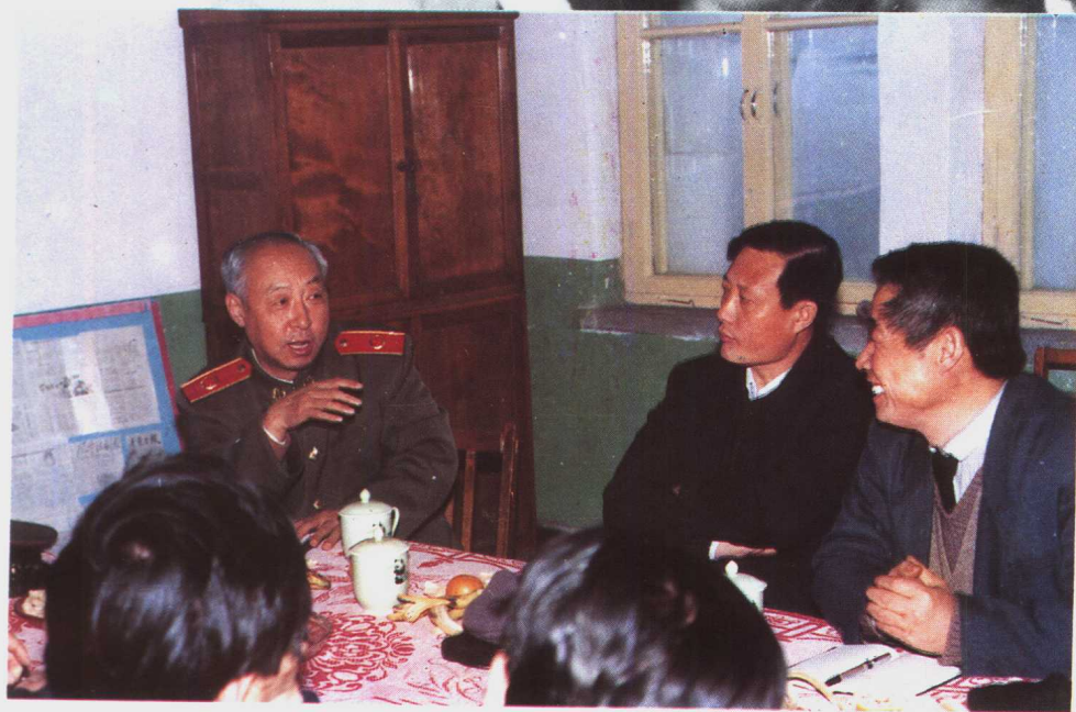
市人民检察院 检察长樊痴1985年 在大中型企业领导 干部座谈会上解答 有关法律问题