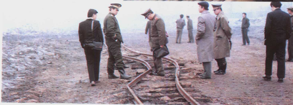
法纪检察 人员勘验重大 事故现场 (1985年)