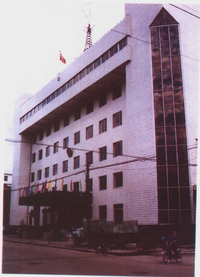
1992年12月 落成的丹东市中级 人民法院办公楼