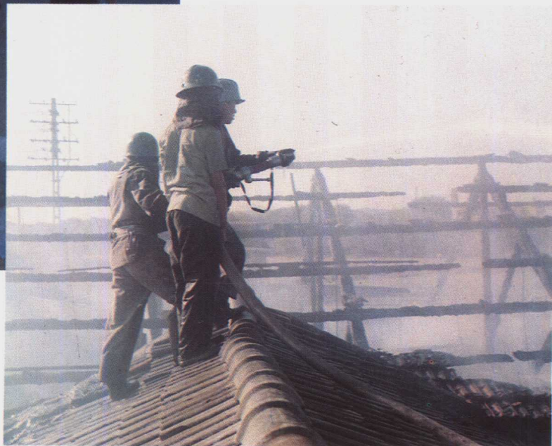
消防战士在灭火 (1980年)