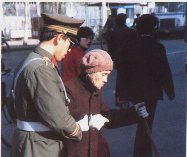
执勤民警扶老人过马路 (1985年)