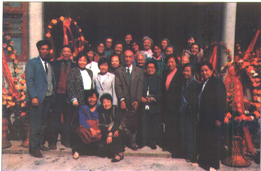
广东省副省长李兰芳(前排站立左起第3人)同满族群众一起参观国家二级美术师李伟芳(满族、前排左起第7人)的个人画展