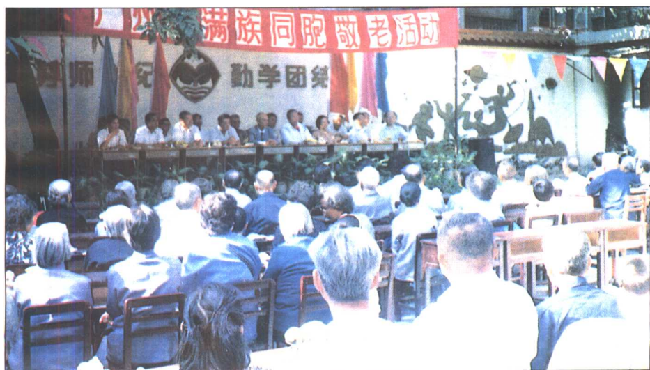
广州市满族同胞敬老活动