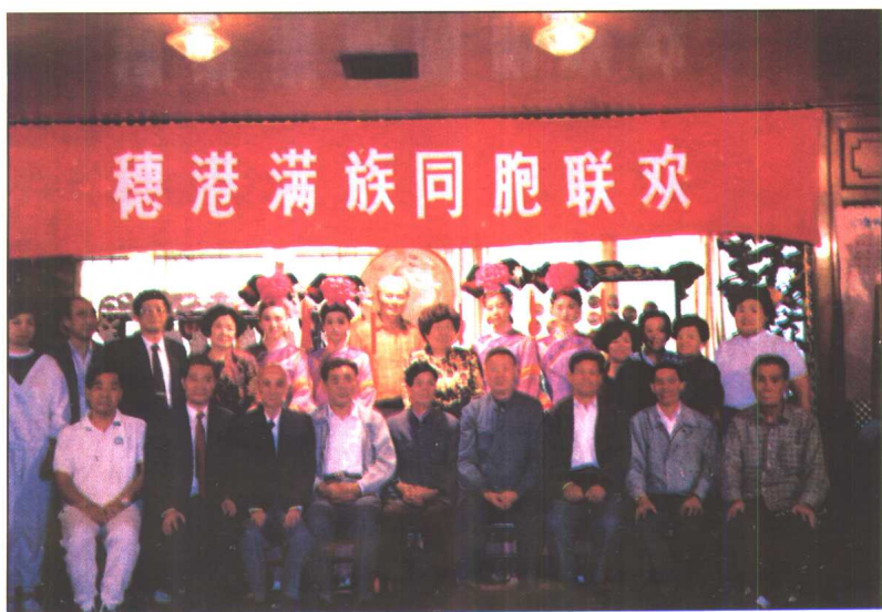
穗港满族同胞联欢