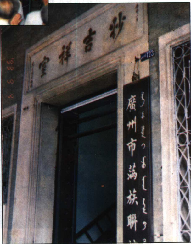
广州市满族联谊会