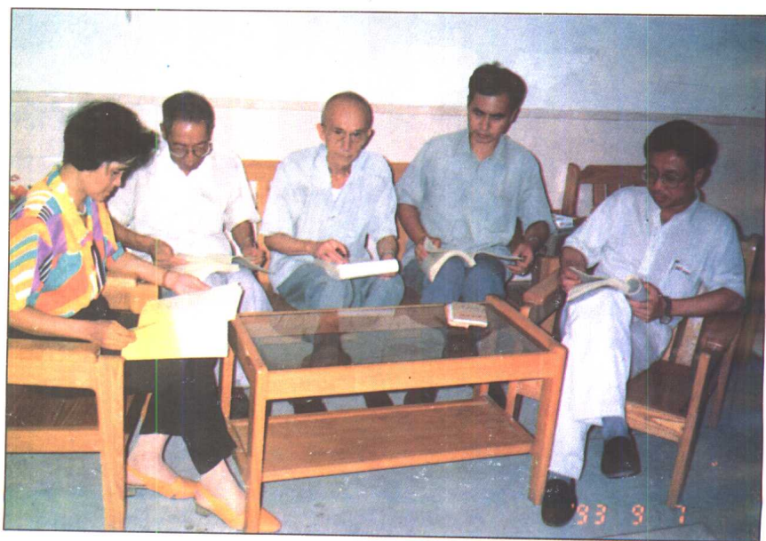
《广东满族志》编写组人员在研究编纂工作