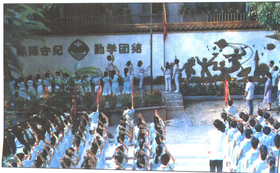
满族小学师生举行升旗仪式