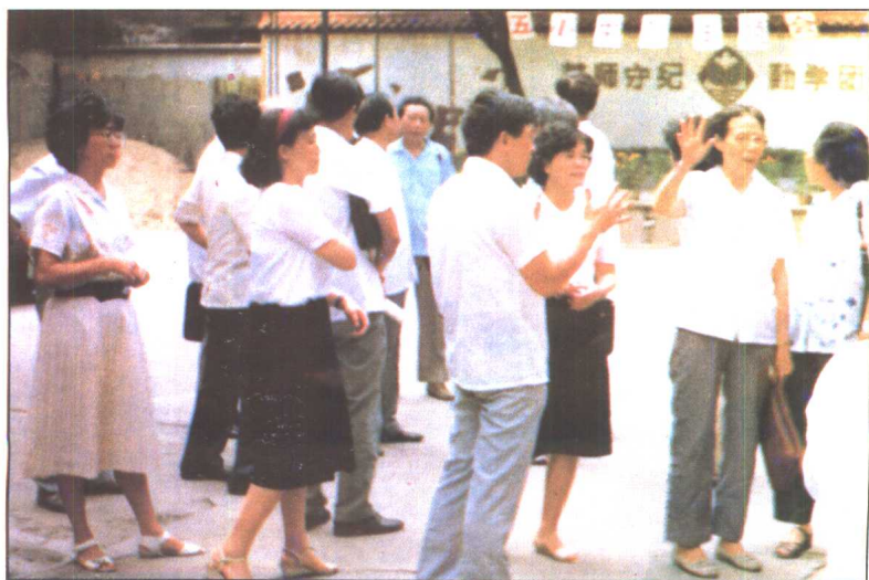
原广州市副市长王玄(中间、女、向师生挥手致意)视察满族小学