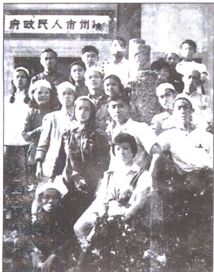
50年代初，回、满族青年积极参加广州市人民政府组织的活动