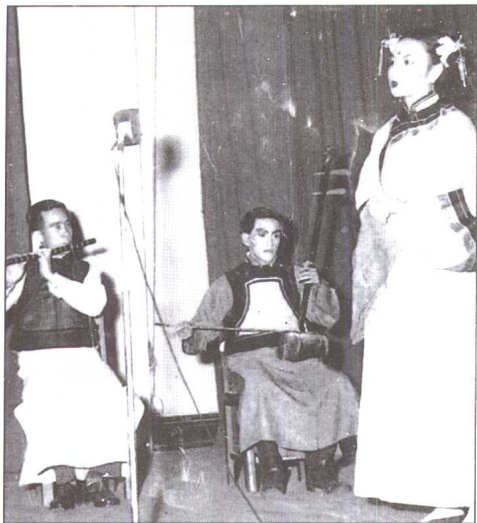
1957年，满族代表队参加全省民族文艺会演，演出《灯盏子花》