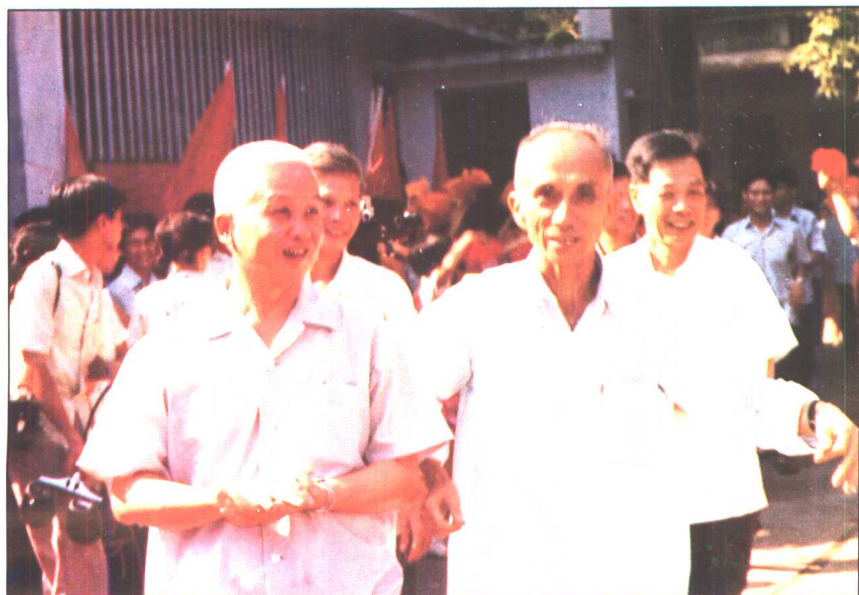
原中共广州市委副书记罗范群(前排左第1人)视察满族小学