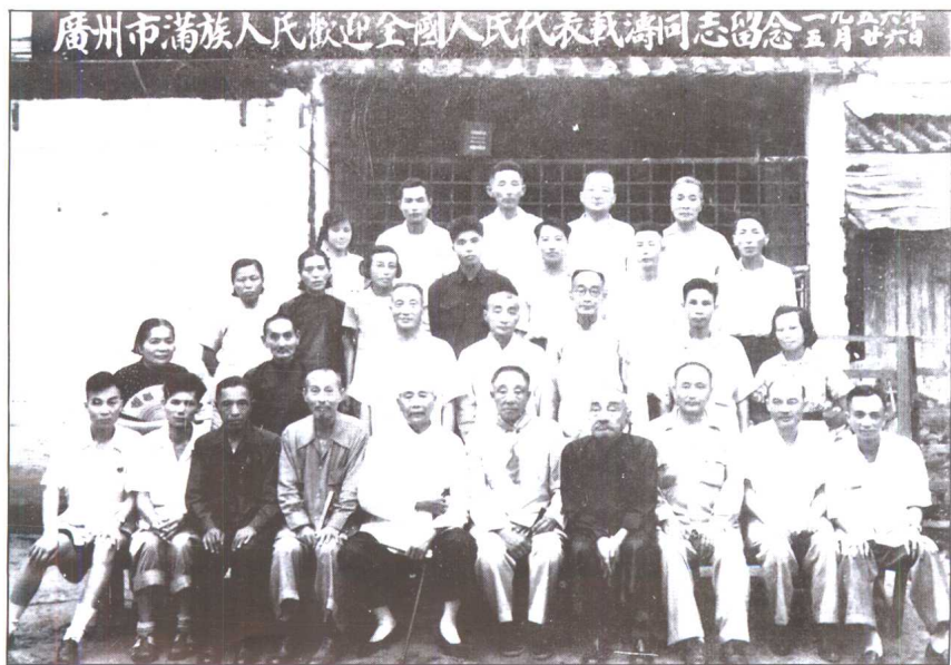
1956年，广州市满族代表欢迎全国人大代表我濤（前排左起第6人）来穗