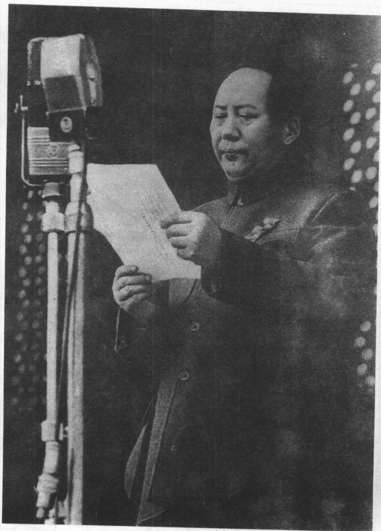
一九四九年十月一日，毛泽东在北京天安门城楼上宣告中华人民共和国成立。