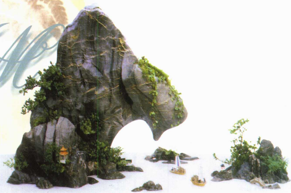
威振南天 鷹嘴奇岩