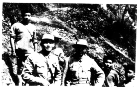
▲ 远征军指挥员在土人向导下观察前线敌我情势