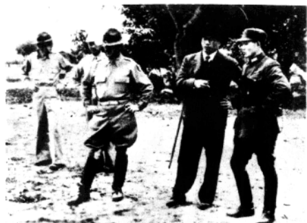
▲宋子文视察驻印军