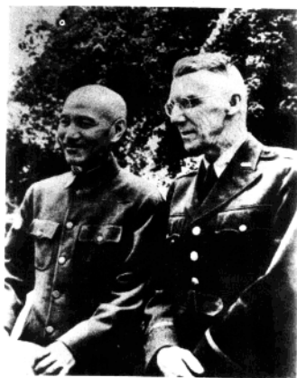
◀ 中印缅战区总司令蒋介石与美国参谋长史迪威在一起