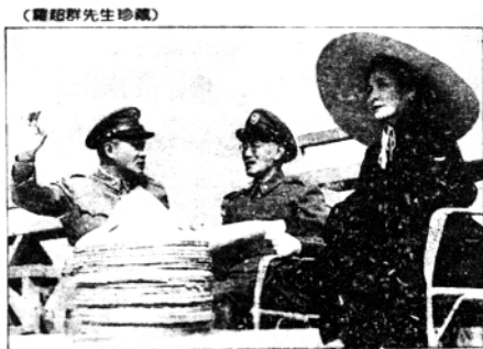
▲先總統蔣公與夫人宋美齡視察部隊訓練。

就在丘吉尔乐观地对战争进行估计的时候，另一位世界反法西斯战争“巨头”斯大林正在克里姆林宫的掩蔽部地下室昏昏欲睡。当作战部长华西列夫斯基中将匆匆地把日本偷袭珍珠港的消息向最高统帅报告时，斯大林忽然两