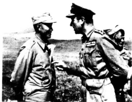
▲ 史迪威与前线指挥员在讨论作战计划