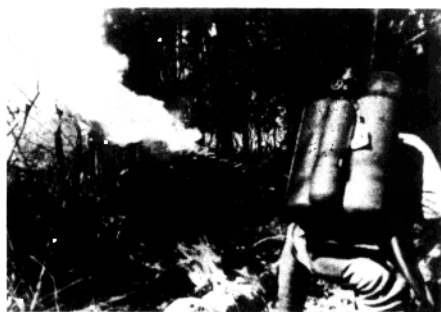
▲强越野人山时，驻印军用火焰喷射