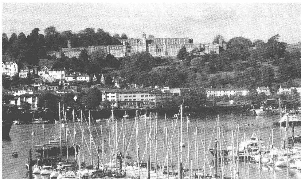
从风景秀丽的达特茅斯小镇远眺气势非凡的皇家海军学院建筑群

1902年，国王爱德华七世亲自出马，为海军学院选定了新校址，1905年9月14日，皇家海军终于在英国西南沿海的一个小城——达特茅斯（Dartmouth）创建了今天规模更加宏伟的皇家海军学院。作为一个骁勇善战的国王，我相信做出这一决定绝不仅仅因为小镇的宁静与秀丽，更重要的是小镇周边的达特河（River Dart）以及风平浪静的宽阔海面。位于达特河与大西洋的交口处的达特茅斯在历史上曾经发生过很多重要的事件，比如1620年9月英国第一艘运载102名清教徒移民驶往北美殖民地的船只五月花“The Mayflower”就是从达特茅斯的港口出发的。1944年，诺曼底登陆发起前，盟军的一部分舰船也是从这里启航。这两个影响世界历史的事件都有达特茅斯的身影，足见其重要的战略地位和历史地位。