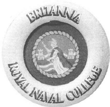
英国皇家海军学院校徽

10年之后，小小的“布里塔尼亚”号军舰已经无法满足皇家海军的培训需求，随着海军的逐步壮大，1873年，皇家海军学院迁址于伦敦郊外的格林尼治小镇。以前皇家海军医院的房屋设施为基础，就在格林威治天文台的山脚下，第一所位于陆地上的皇家海军学院应运而生，有意思的是，横跨东西半球分界线的皇家海军学院从那时起就担负起了培训东西两个半球海军军官的重任。包括英国国王乔治五世等一批优秀的皇家海军军官就是在这个时期从格林尼治小镇的海军学院中培训出来的。随着学院培训人数的增加，小小的格林尼治小镇开始变得拥挤不堪，与此同时，远离大海的格林尼治小镇无