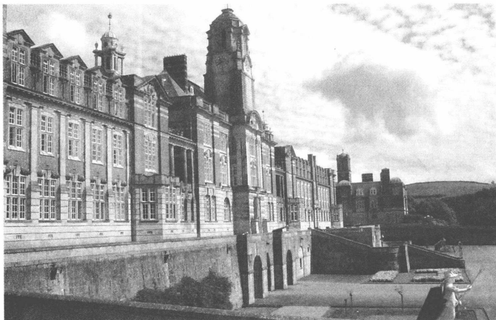
雄伟的皇家海军学院主楼

打开英国地图，沿着英伦三岛的海岸线，你会发现有许多大大小小的河流与海洋的交汇处都有一个以XXmouth命名的地方，mouth顾名思义在这里就是河流开口的地方，比如皇家空军的著名军港Plymouth，以及皇家海军的司令部所在地Portsmouth等，古老的英国人在起名字方面与我们中国文化也有相通的地方，只不过文明古国的中华祖先起个名字更为艺术罢了，比如我国的镇江、上海等名，同样是在江边、海边，但名字中更多了几分含意。