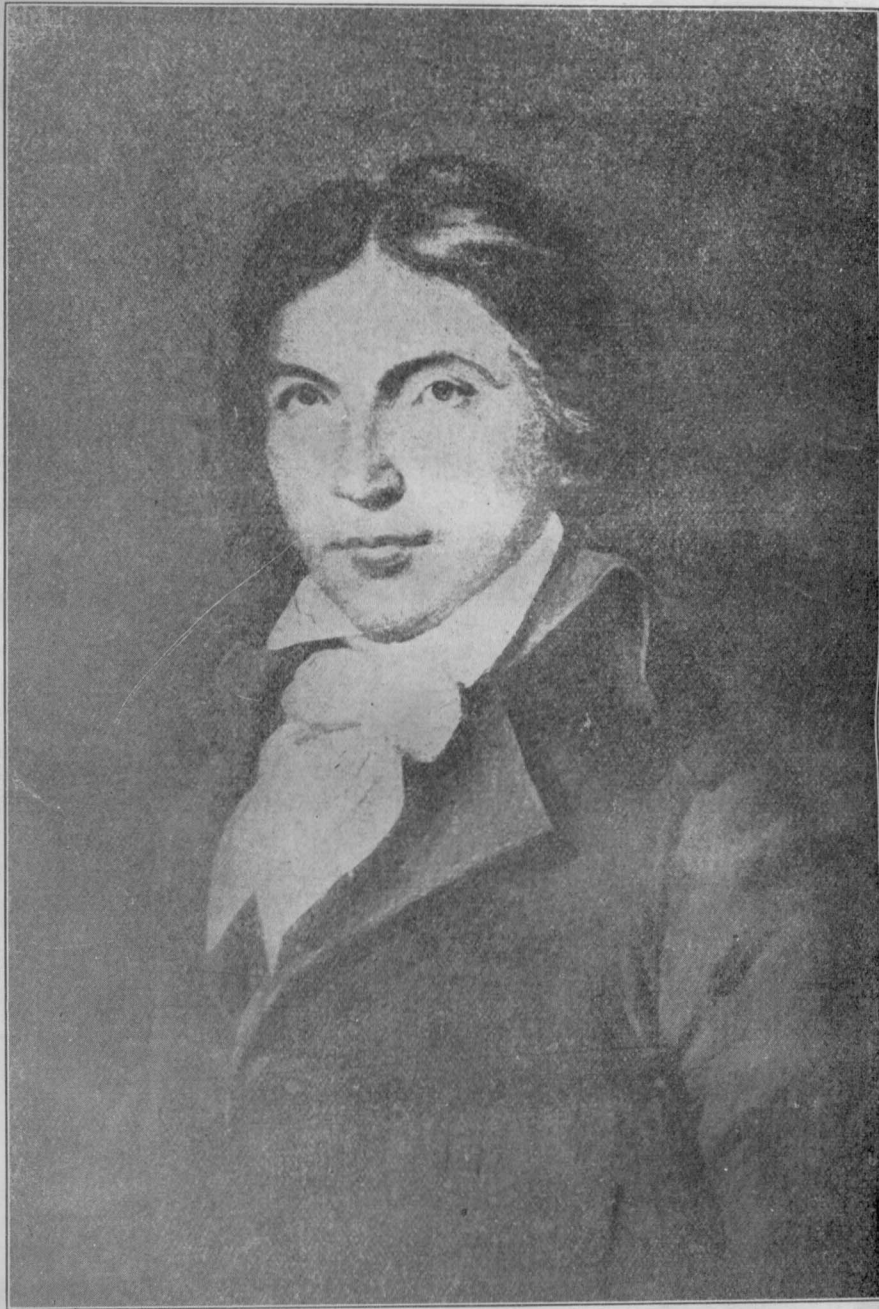
倫保德者記聞新年少命革吹鼓