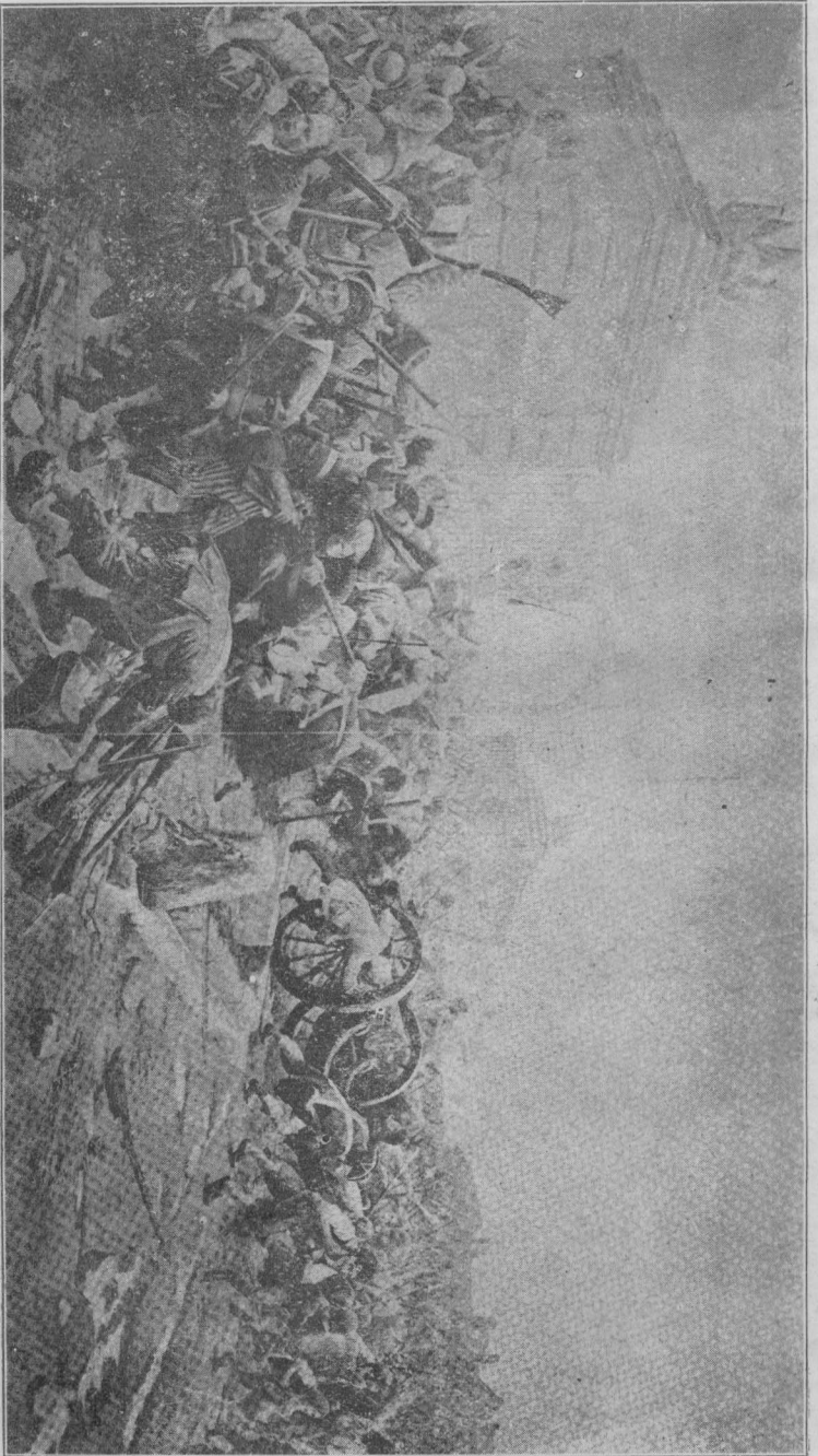
庫 軍 取 奪 民 市 黎 巴