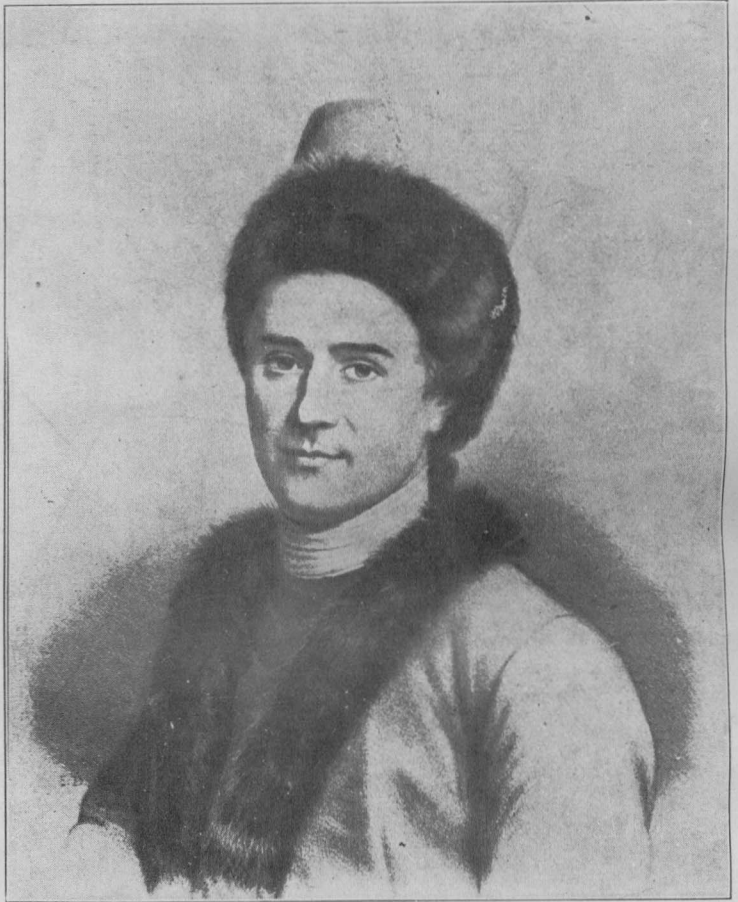
騷 盧 之 義 主 權 民 倡 提