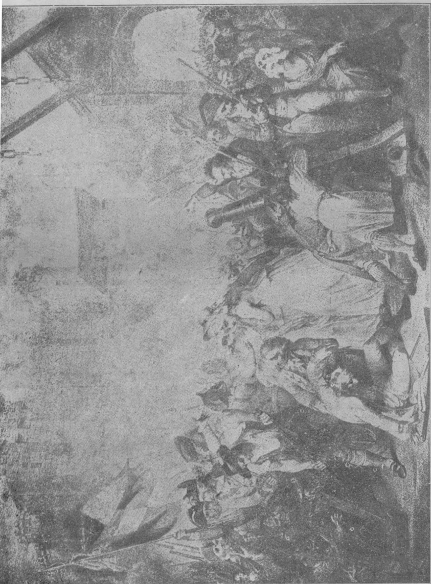
法蘭西人攻破巴士巴獄之圖