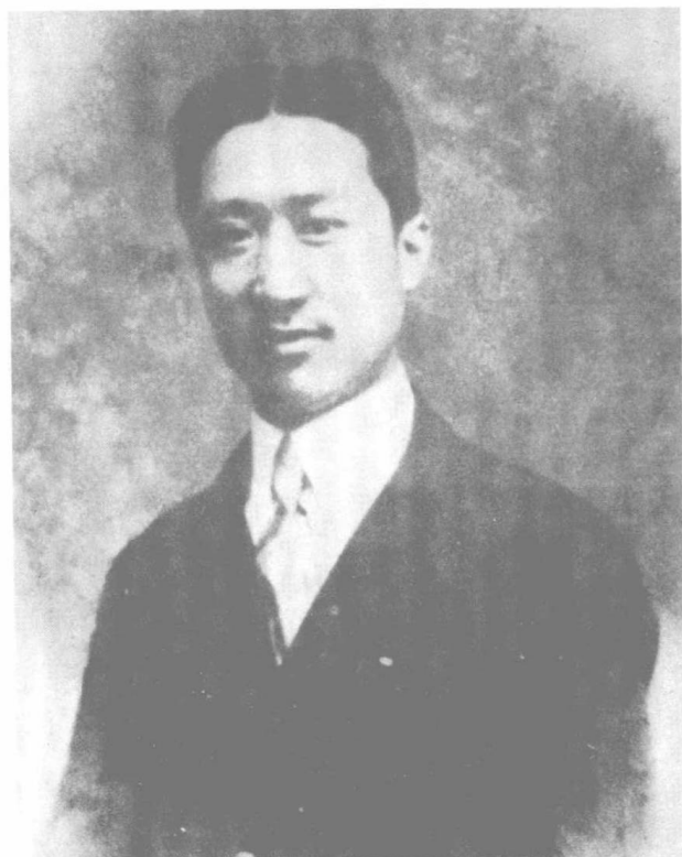
一九二二年摄于法国