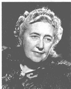
阿加莎·克里斯蒂 Agatha Christie (1890—1976)