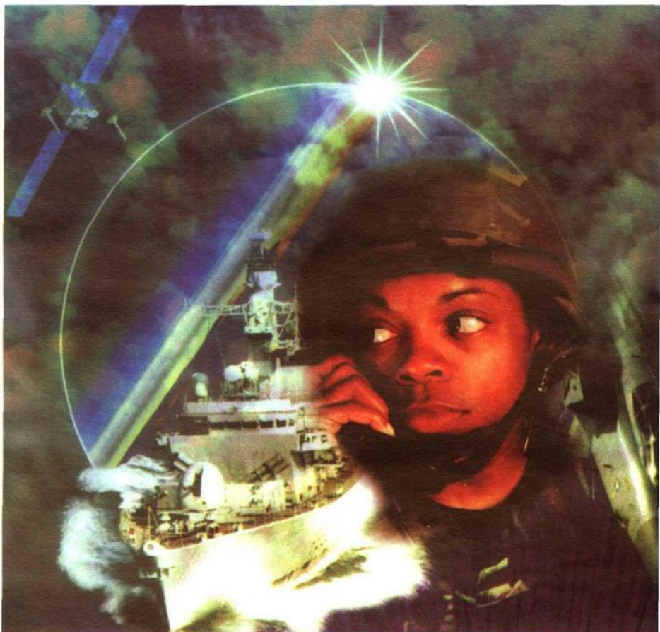
信息边疆无形无界

时代总是在超越历史中发展，人类的边疆观也是这样。如领海的出现，是在人类的生产生活大量进入海洋时才被纳入国家主权范畴的；领空的出现，是在飞机诞生后才刷新国家边疆概念的；随着人类向太空迈进，外层空间“天疆”也隐约出现。进入信息时代后，信息技术的飞速发展已经使边疆观开始向更大、更广阔的概念延伸，传统战场在演变为陆、海、空、天、电五维战