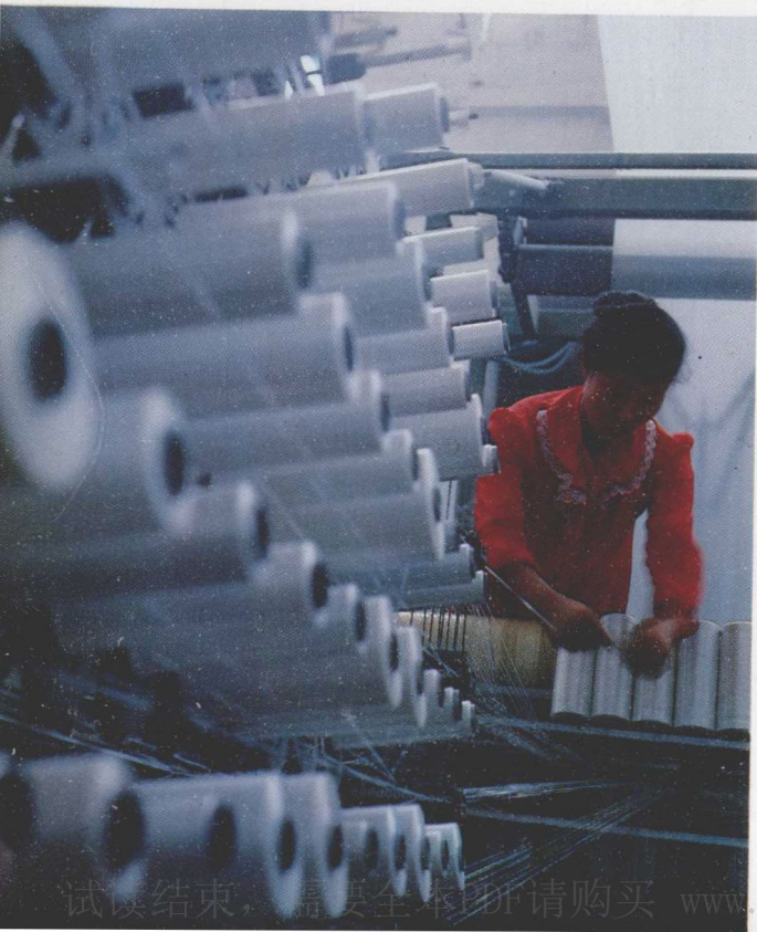
◀ 吴忠市塑料编织厂