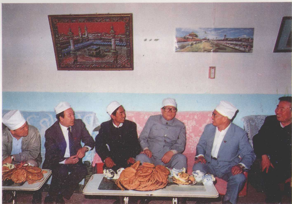
▲ 江泽民同志1991年访问解放村(回民村)回民家庭