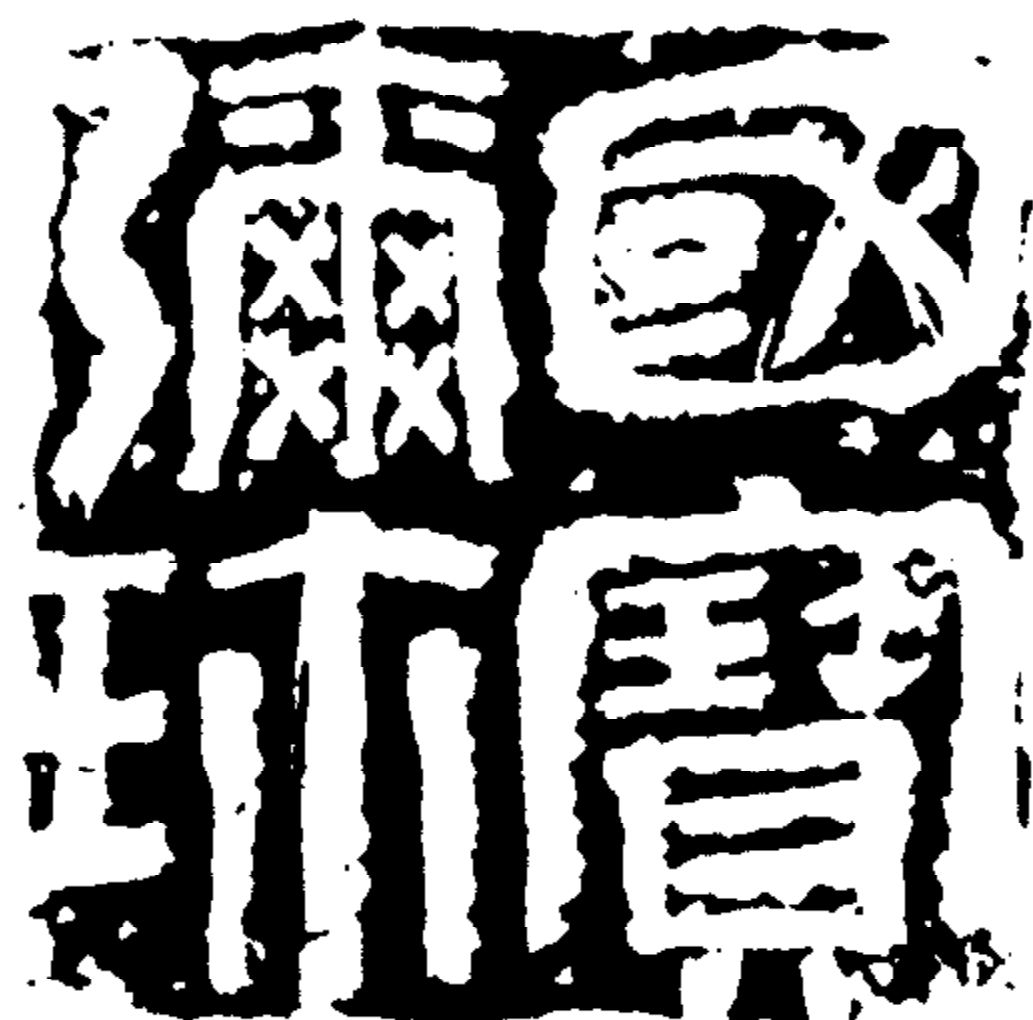
國寶彌珍 篆刻：石開