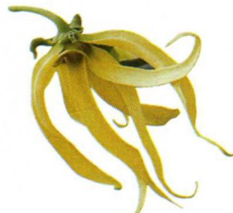
依兰依兰: 缓解紧张, 放松精神。