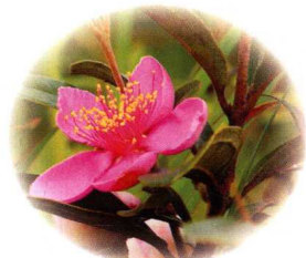
桃金娘：果可食用，补虚止血。