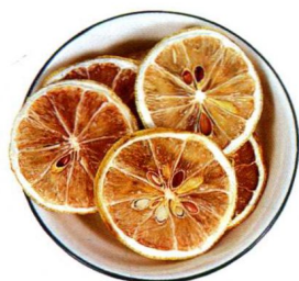
干柠檬：美白、平衡油脂、收敛毛孔。