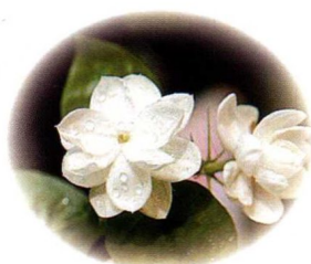
茉莉: 能避蚊虫, 解郁舒气。