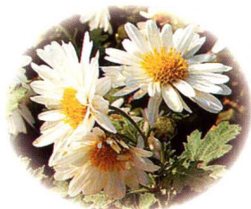
除虫菊：花中含有除虫菌素，可杀蚊虫。