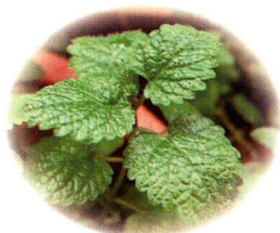
薄荷：具有特殊的芬芳香气，可清脑提神。