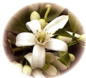
橙花：抗菌、镇定、保湿、美白、淡斑。