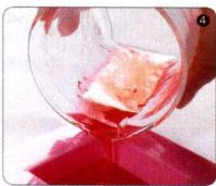
④ 将调好的皂液倒入皂模中，静置至少 2 小时，等待皂液变干，便可脱模。