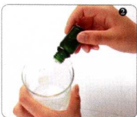
② 在皂基液中加入薰衣草精油，搅拌均匀。