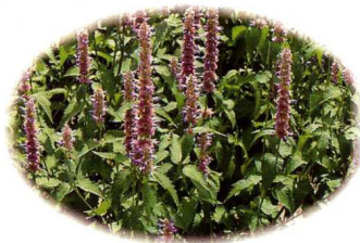
牛膝草：镇静、杀菌、淡化皱纹。