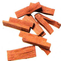
干檀香：疏风解表、活血调经。