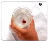
③ 将色素导入皂液，搅拌均匀，如不喜欢色素，则可不添加此成分。