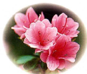
杜鹃花: 入药可以治风湿, 祛肿消痛。