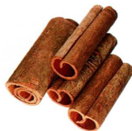
干肉桂：散寒止痛、活血通经。