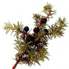
干杜松子：收敛、杀菌、解毒、强化肝功能。