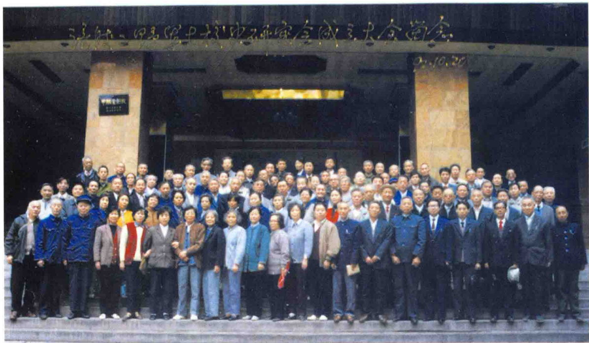
涪陵二野军大校史研究会成立时全体成员合影 1992年10月20日