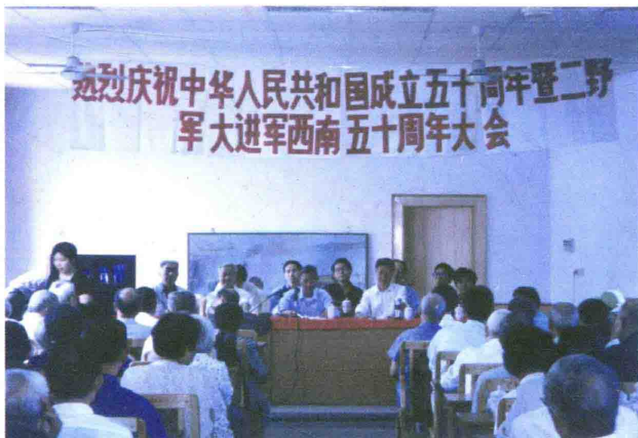
庆祝建国五十周年