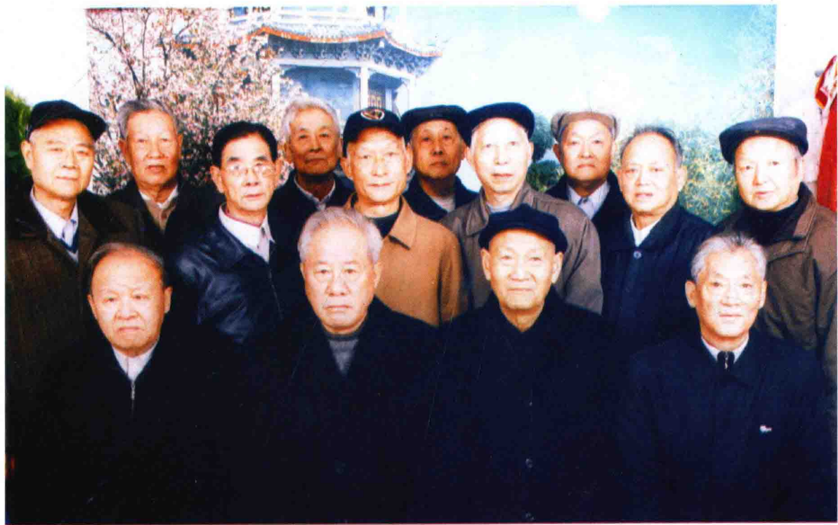
《风雨征程》编委会顾问与成员合影