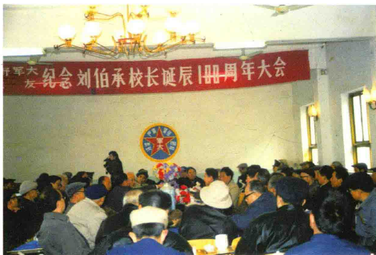
纪念刘校长诞辰100周年