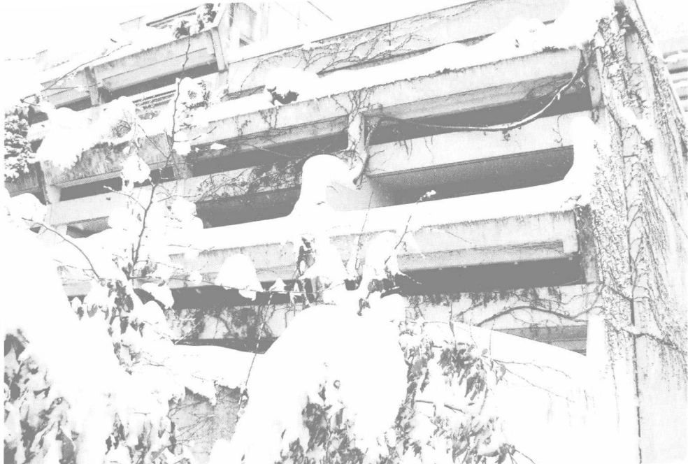
上图：Connollystrasse 31号的后面。人质当时被囚禁在二楼右后方的房间内。

如此，以色列仍然是最需要训练和部署反恐特种部队的国家。1972年5月8日，恐怖分子再一次劫持了一架Sabena航空公司的航班，该航班最终在特拉维夫降落。这一次以色列成功实施了针对恐怖分子劫持飞机的反恐行动，该行动是以色列反恐特种部队解救人质的典型成功案例。其中使用的诸多技巧现在已经被世界各国的反恐特种部队作为行动标准，比如在相同型号的飞机上进行模拟行动，使用伪装帮助救援队伍接近飞机，以及使用诈术（该次反恐行动中有300多名以色列士兵伪装成被释放的巴勒斯坦士兵，他们乘坐伪装的红十字会救护车接近飞机）等。以色列反恐部队最终成功击毙或抓获了劫持飞机的恐怖分子并解救了全部人质。（这里还有个有趣的事情值得一提，参与本次反恐行动的成员中有两人后来担任了以色列总理，他们是埃胡德·巴拉克和本杰明·内塔尼亚胡。其中内塔尼亚胡在行动中负伤。）以色列以实际行动告诉我们，对恐怖分子的暴行我们没有必要退让和妥协，只要拥有专业的救援队伍和国家、人民的支持，我们在应对恐怖袭击时应该展开积极的行动。