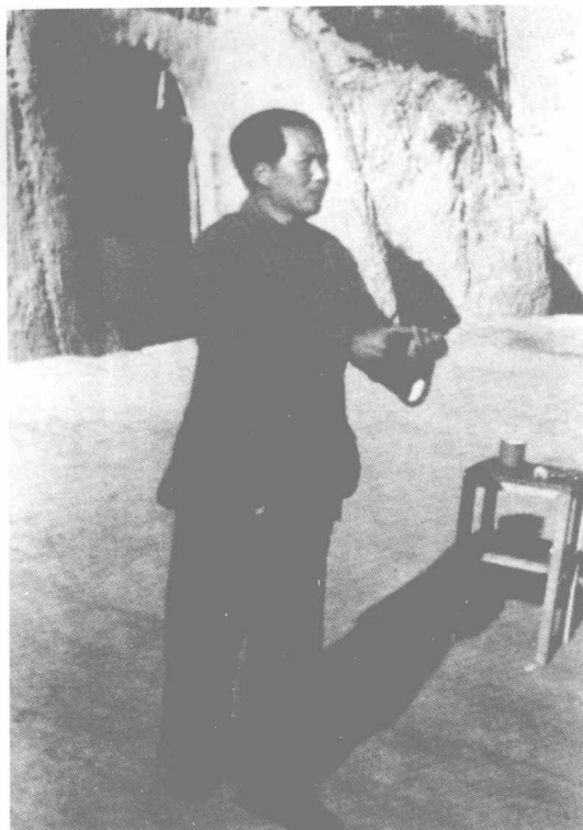
毛泽东在延安给干部作报告