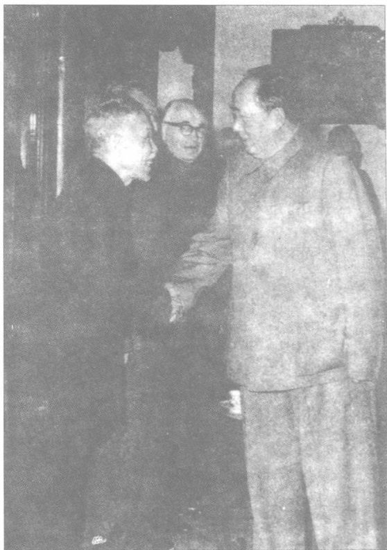
毛泽东接见著名历史学家翦伯赞