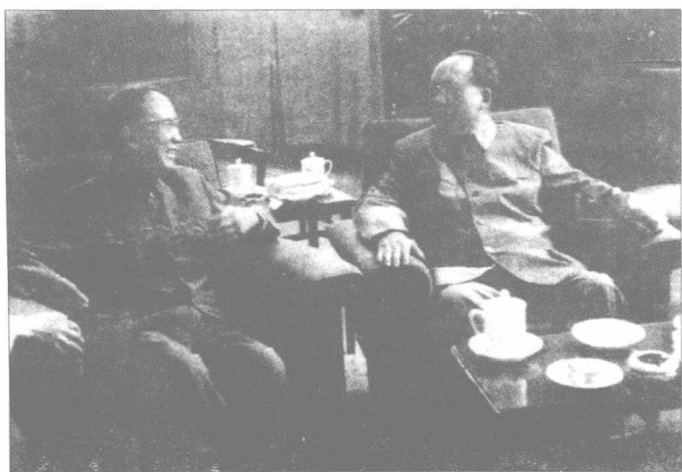
毛泽东与中国科学院院长郭沫若亲切交谈