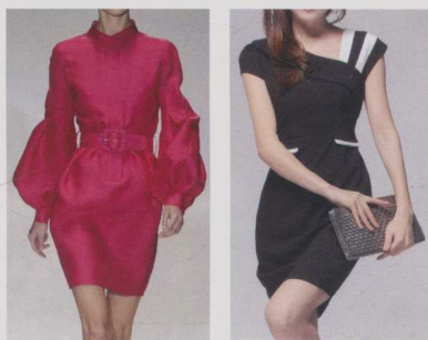
▲ 图 1-4 前卫时尚

如图 1-4 所示，极简主义是欧美风格诸多派系里最具前卫个性的一种时尚元素，极简主义风格通常是通过利落的线条、精致的剪裁和时髦的色彩搭配来塑造个性鲜明的潮流造型，以舒适、性感、淡然、休闲的设计风格突现更靓、更惹眼的前卫主线，做个性、时尚的女性，享受与众不同的潮流造型。前卫性感且又不失甜美，大胆、前卫穿衣风格深得年轻女孩的青睐。