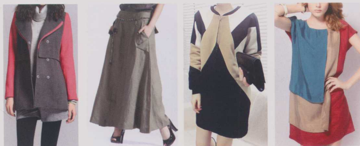
▲ 图 1-2 简约大方

如图 1-2 所示，欧美女装款式设计简洁，大方、线条感明显。简洁流畅的造型线条，采用流行舒适的面料，并适应正装休闲化发展趋势。运用简洁分割设计和色彩搭配组合，以都市时尚休闲为设计灵感，散发出女性华丽青春的名媛气质。