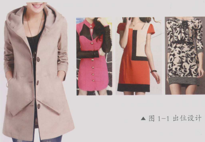
▲ 图 1-1 出位设计

如图 1-1 所示，出位大胆的创新设计总是给人惊喜，简单熟练的剪裁呈现出大方自信。如性感网纱透视的秋装连衣裙，隐隐约约地透露出性感与时尚，前胸镂空设计，后背透视面料拼接装饰，前领口金属扣子对比衬托装饰，是一件很有设计点的欧美风格秋装。