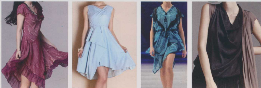
▲ 图 1-5 飘逸质感

如图 1-5 所示，飘逸、质感、休闲是欧美女装的风格特点之一，通常采用轻薄舒适的面料以及简约大气的廓形，通过不同的色彩组合追求色调和谐、便于搭配。柔软的面料，修身的裁剪，飘逸的休闲风格，让穿着者独有的魅力从不同的角度展现出来。注重穿着的品位，追求时尚但又不过分张扬。这种风格能任意穿出率性利落感，营造出舒心、飘逸、不落俗套的休闲生活氛围，打造令人倾心的魅力衣装。