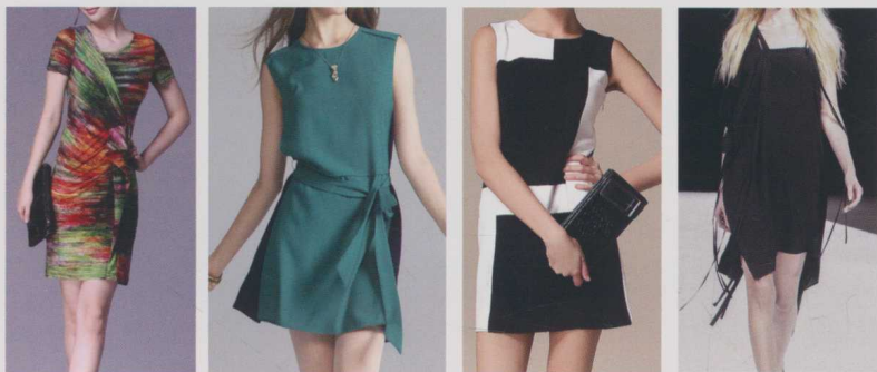
▲ 图 1-3 张扬个性

如图 1-3 所示，欧美女装最吸引人的地方在于它所运用的夸张设计手法，以满足都市人们渴望宣泄的心情。个性的张扬就是快乐的源泉。设计风格借助截然不同的元素，