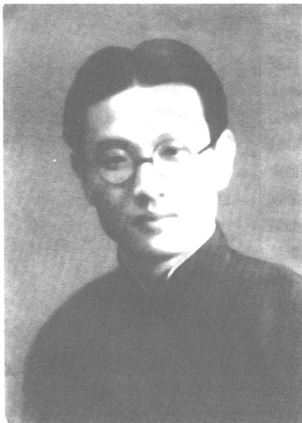
董浩云 22 岁时的留影

关键是中国的航运业不发达，国内民营的轮船公司并不多，较大的有上海三北轮船公司、烟台的政记公司以及重庆的民生实业公司。上海的三北轮船公司是由中国航运界前辈虞洽卿创办的。最高峰时有20多艘船舶，但都是一些吨位较小的沿海及内河航船，总载重量才5万多吨。三北轮船公司在外商及国营招商局轮船公司的夹缝中奋力苦挣，终因虞洽卿的去世而每况愈下，生意萧条，逐渐被外国的轮船公司所取代。