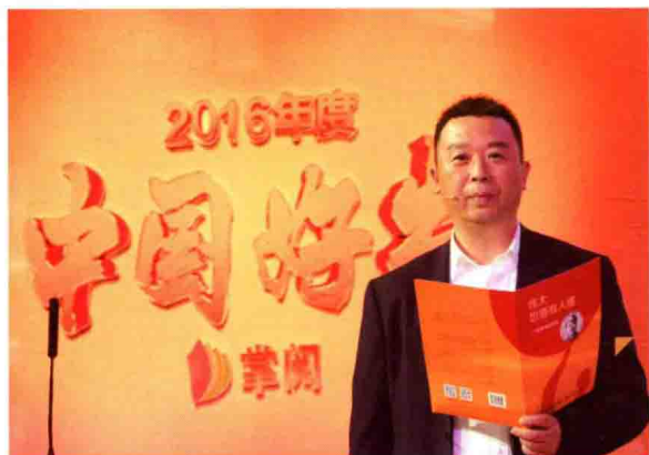
本书荣获“2016年度中国好书”。