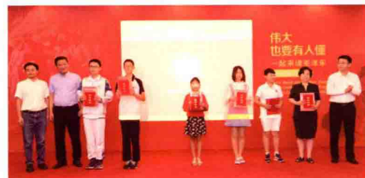
在由中国作家协会儿童文学委员会主办，中国少年儿童新闻出版总社承办的本书版权输出美国发布会现场，出版方为该书读书活动获奖代表颁发证书。