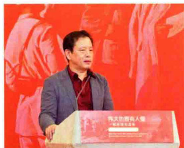
中国作家协会副主席李敬泽在本书版权输出美国发布会现场表示：韩毓海教授在他多方面的学术生涯中始终坚持以毛泽东的立场、观点、方法认识中国的问题。这使他在一个毛泽东式的辩证过程中达到了对毛泽东和对中国的精深认识。