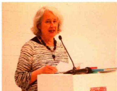
国际安徒生奖评委会主席、IBBY基金会主席帕奇·亚当娜认为：了解毛泽东就是了解今日中国的历史和发展。本书为研究现代中国、中国革命和毛泽东思想增添了一部重要著作。这是一部信息量巨大且非常有趣的有关当年恢宏历史的著作，饱含发人深思的内容。