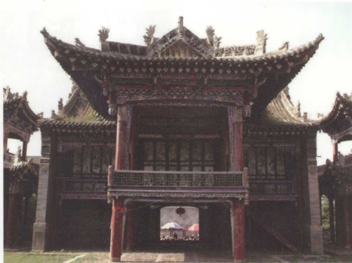
老戏台 民国(上) 戏楼 民国(下)