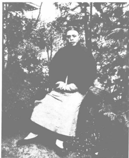
鲁迅像 民国（上） 王国维像 民国（下）