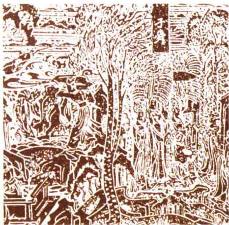
◎ 壁画艺术中宁静的尧舜时代