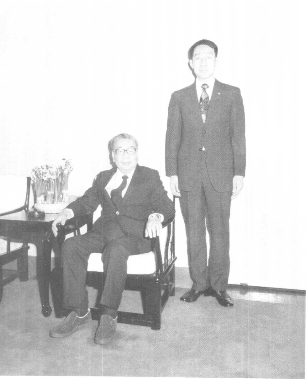
在慈湖蔣公靈寢守靈期間，和蔣經國合影留念。