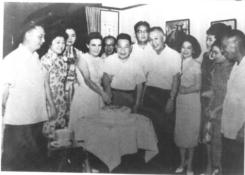
長安東路官邸時代的蔣經國、蔣方良夫婦一家人和王叔銘、趙聚鈺、嚴靈峰等友人餐敘一堂。