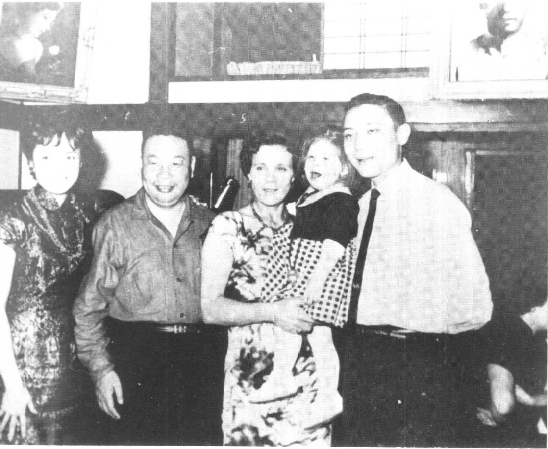
蔣經國夫婦原本對蔣孝文抱有極高期望。