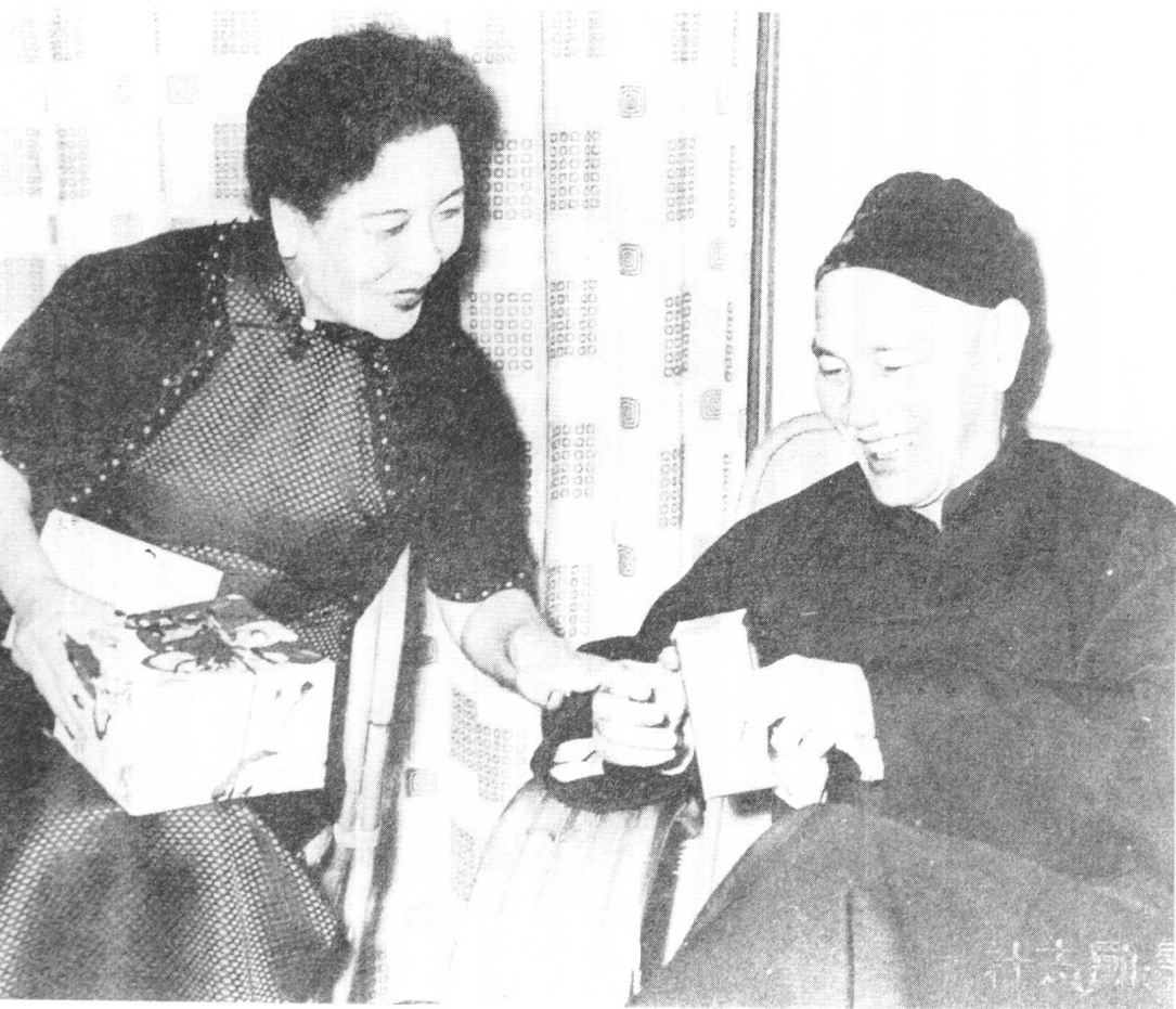
蔣介石夫婦互贈聖誕禮物。