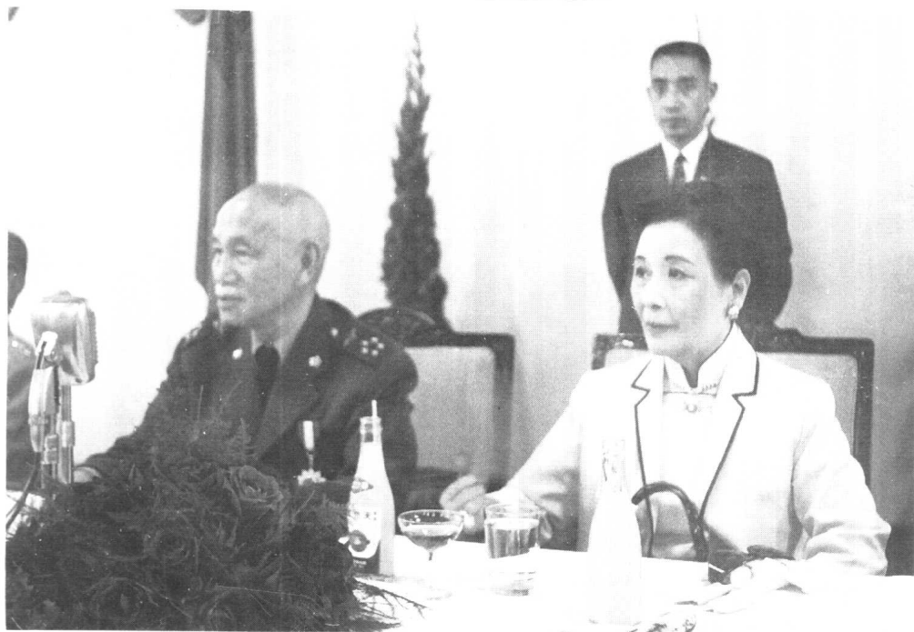
貼身侍從副官的任務：隨時伺候蔣介石。