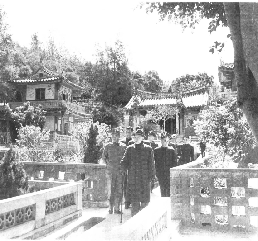
蔣介石到天涯海角，都有隨從在旁保護伺候。