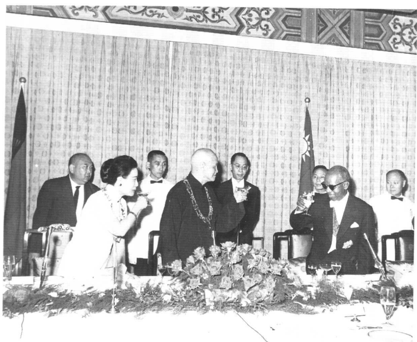
蔣介石國宴款待外國元首，翁元穿圓山飯店服務人員服裝「喬扮」侍者，保衛元首安全，上圖為沙烏地阿拉伯國王費瑟來訪。