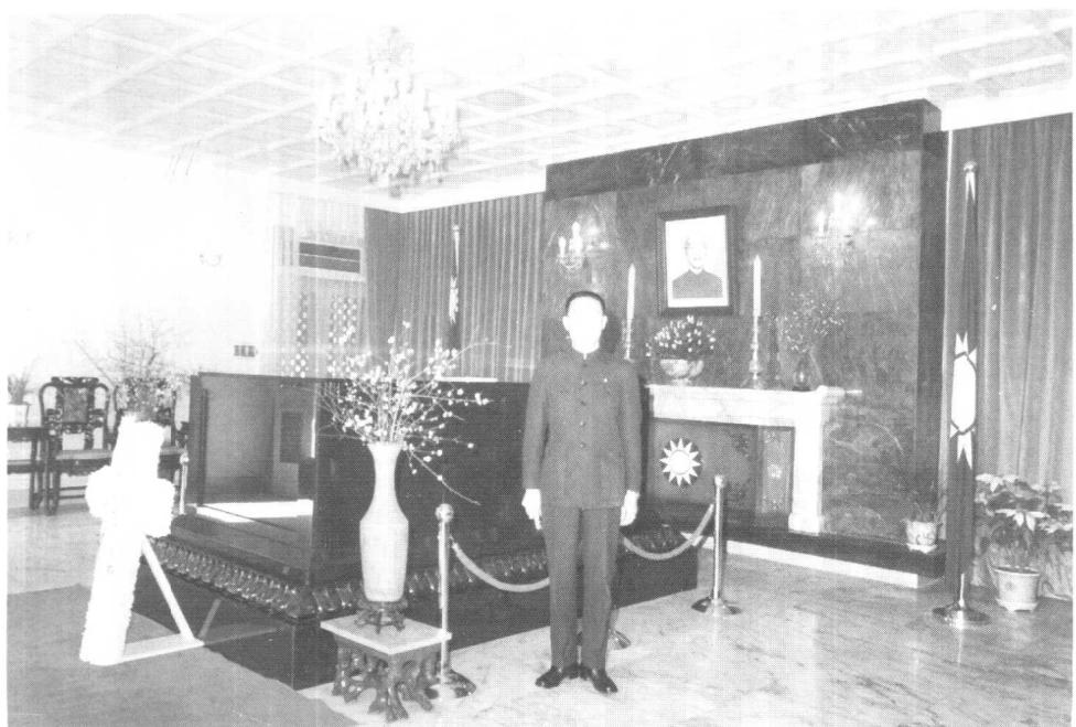
蔣介石逝世後，翁元負責在慈湖陵寢守陵，時為1976年元