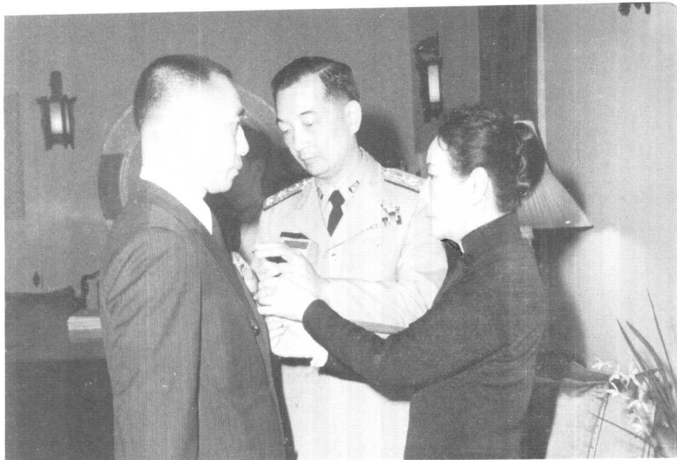
蔣介石喪事料理告一段落，夫人宋美齡頒贈勳章予翁元，旁為侍衛長鄒堅。