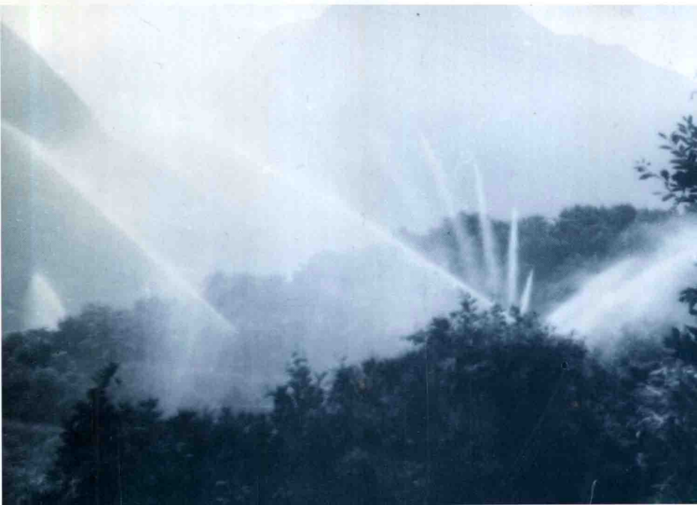
峡口千亩柑桔场自动喷灌