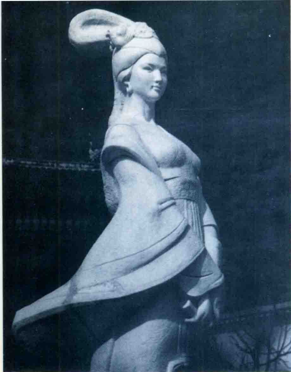
王 昭 君(汉白玉塑像)