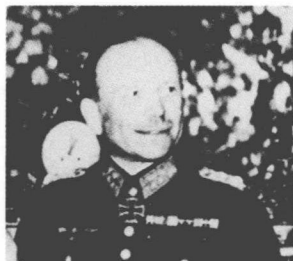
古德里安 | Heinz Guderian

波兰再一次遭到了两个大国的侵略。这两个大国曾经同其他大国一起奴役波兰达 150 年之久，但却不能摧毁波兰民族的精神。华沙的英勇抵抗，表明波兰的灵魂是不可毁灭的。