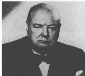
丘吉尔 | Winston Churchill

一有合适的时机就进攻波兰……我们不能期望重演捷克事件。这次得打仗了，我们的任务是孤立波兰。