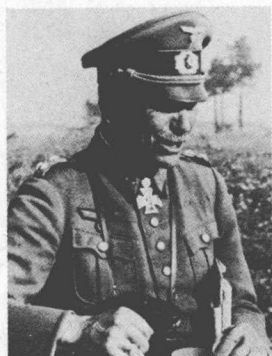
古德里安 | Heinz Guderian

德国陆军上将。1934年创建德国装甲师并任师长，1938年任军长。1939年至1940年对波兰和法国作战。1941年任第2装甲集团军司令，参加对苏战争，同年年底因在莫斯科郊区战败被解职，编入预备军。1943年2月任装甲兵总监，7月任陆军参谋长。1945年3月因作战失利再次被解职。后被美军俘获。