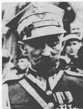
斯米格威·雷兹 | Smigly · Rydz

波兰陆军元帅。第一次世界大战期间，在毕苏茨基领导的波兰军团中任旅长，与俄国军队作战。1918年代表“波兰军事组织”参加临时政府。波兰独立后任国防部长，武装部队总监、总司令。1920年率部进攻苏俄，一度占领基辅。1926年5月，参与毕苏茨基发动的军事政变。1935年，成为波兰事实上的独裁者。1939年德波战争爆发时，任波军总司令。