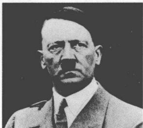
希特勒 | Adolf Hitler

一有合适的时机就进攻波兰……我们不能期望重演捷克事件。这次得打仗了，我们的任务是孤立波兰。