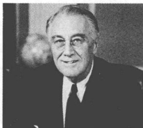
罗斯福 | Franklin Roosevelt