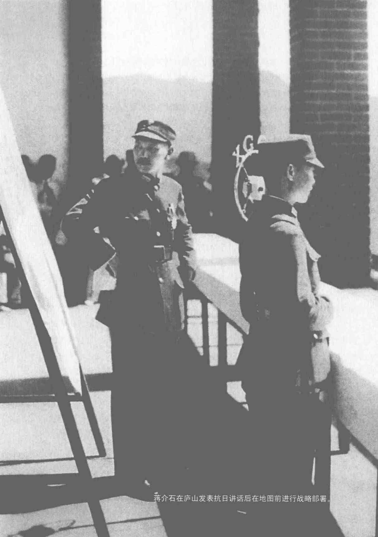
蒋介石在庐山发表抗日讲话后在地图前进行战略部署。