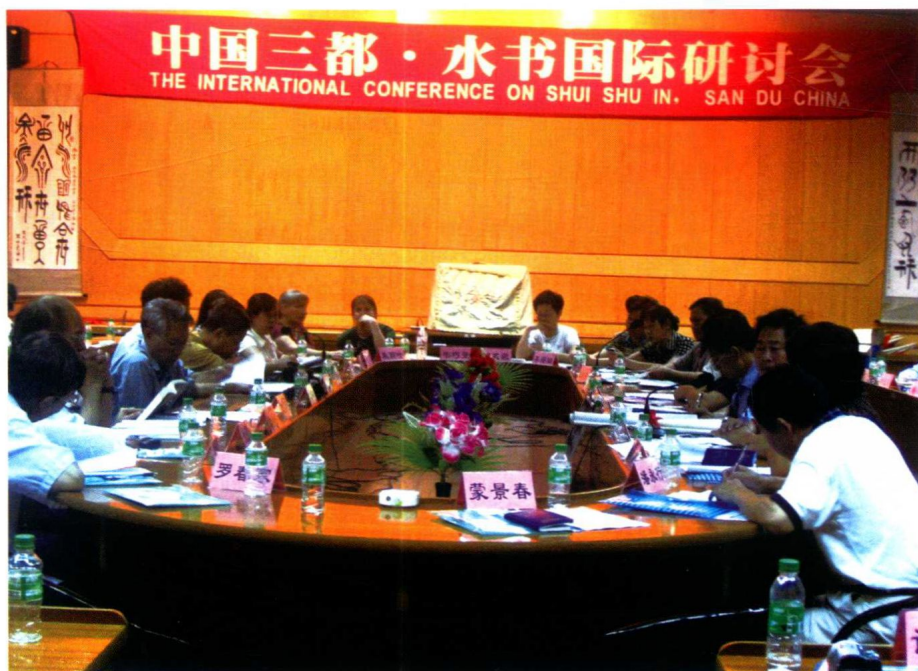
水书国际研讨会的专家学者在发言