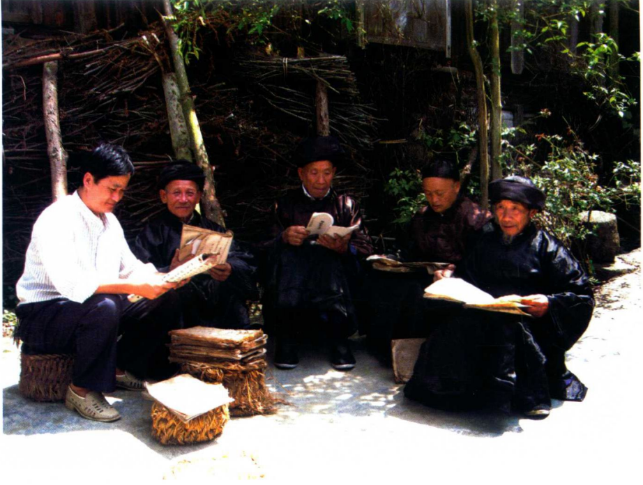
作者与水书先生研究水书传承工作