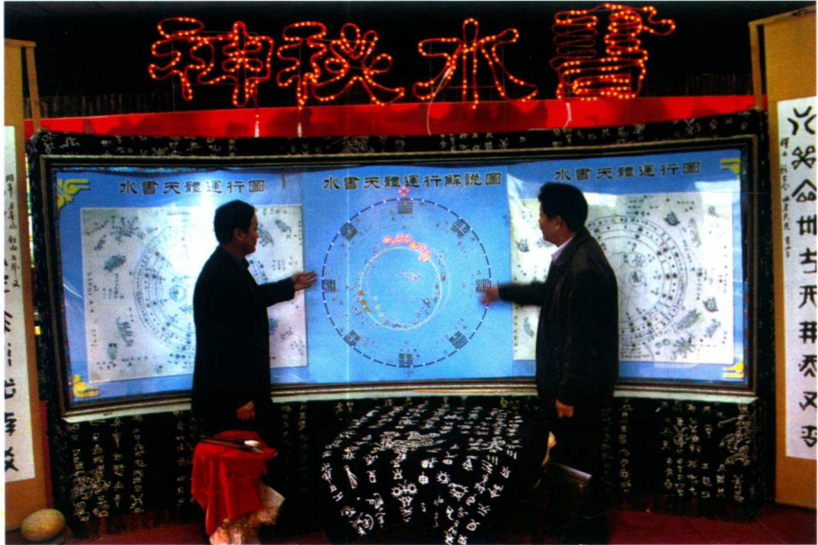
作者讲解水书天体运行图