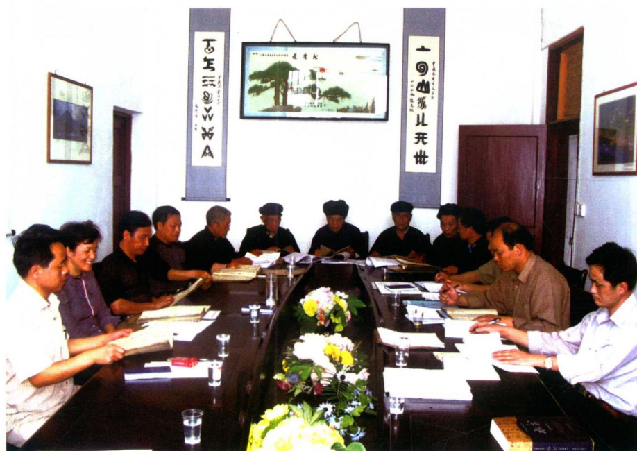
《水书·九星卷》审稿会