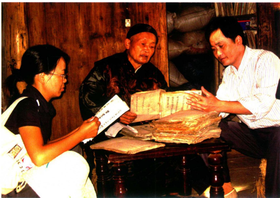
作者向水书先生学习水书