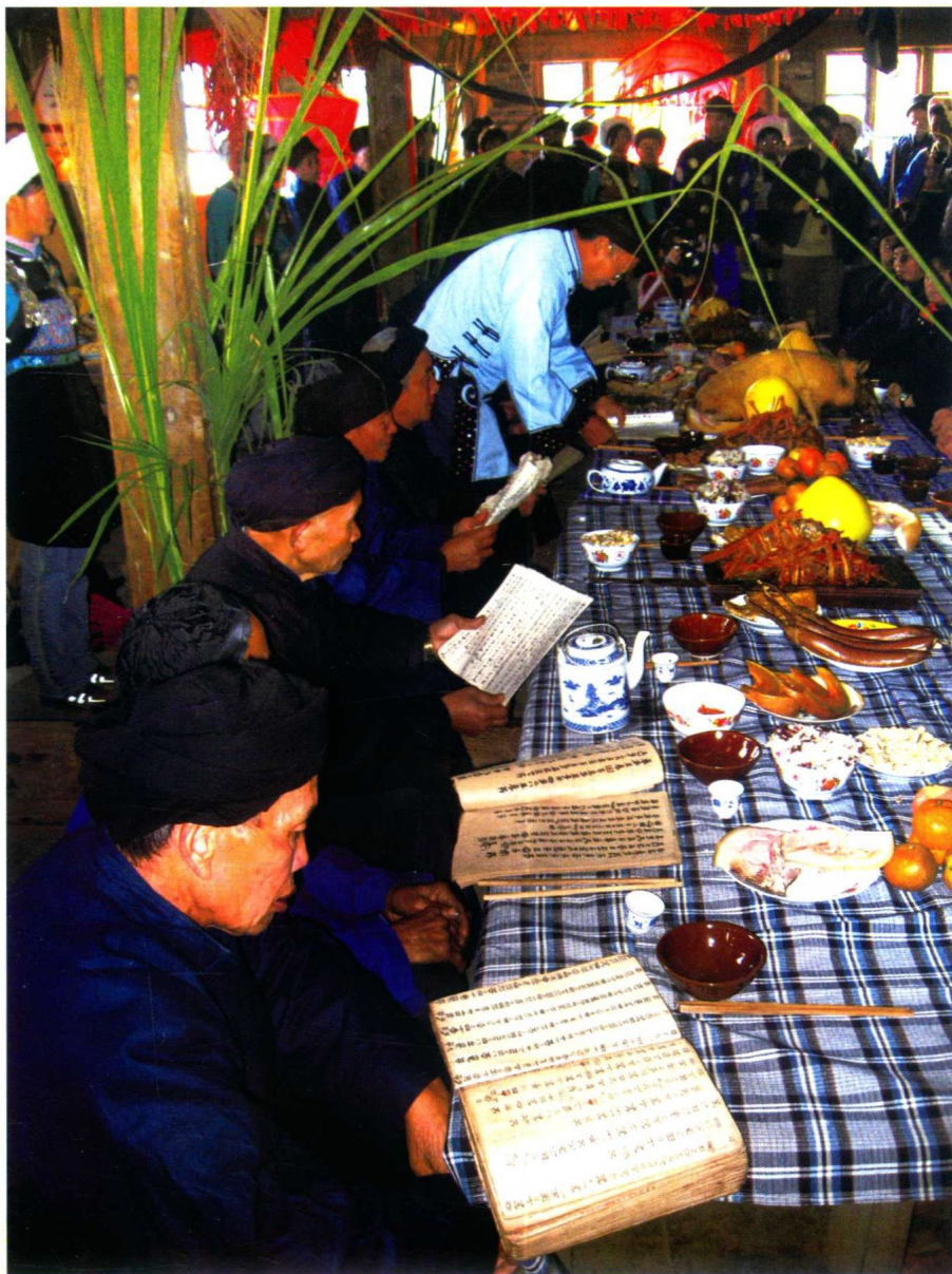
水书先生进行水书习俗活动