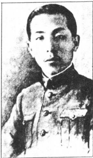
一九二九年四月著中山裝英武挺拔的張少帥