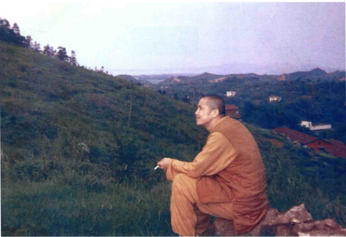
刚在东林寺出家时，面对巍峨的庐山沉思（1993年）