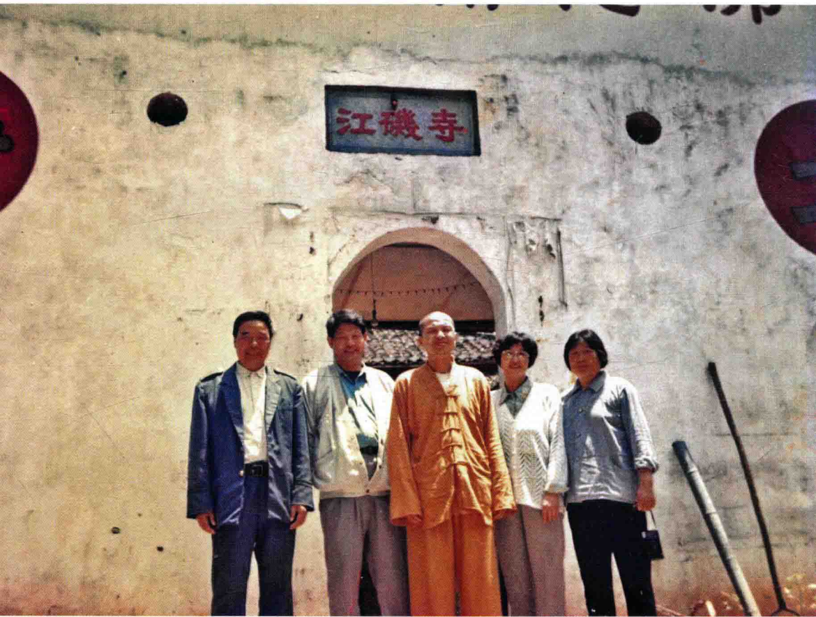
难断兄弟姐妹情，他们到江矶寺探望本人（1995年）