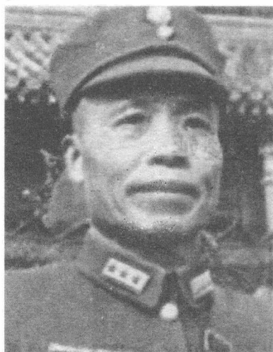
第五战区司令长官李宗仁

北面包括豫西的舞阳、方城、南阳、镇平、内乡数县，东向则包括敌后的大别山和皖北、皖西、鄂东各县。李宗仁决定将长官部暂设于较为中心地带的樊城，以便于指挥。