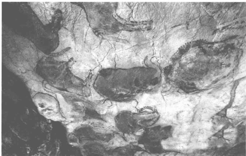
西班牙阿尔塔米拉洞穴的野牛壁画——洞顶牛群，岩洞壁画，约2万年前

的，显然都是对现实生活中动物各种神情姿态的模仿和记录。中国古代认为音乐也是由模仿现实生活中的自然音响而来，《管子》中讲道：音乐是模仿动物的声音而来。对于原始艺术来说，“模仿”确实是一种极其重要的手段。此外，这种说法也肯定了艺术来源于客观的自然界和社会现实，其中包含着朴素唯物主义的观点，具有进步的和合理的内容。