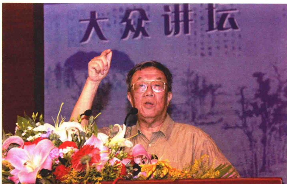
2010年6月30日，王蒙在山东省图书馆与齐鲁晚报联合创办的“大众讲坛”作演讲。