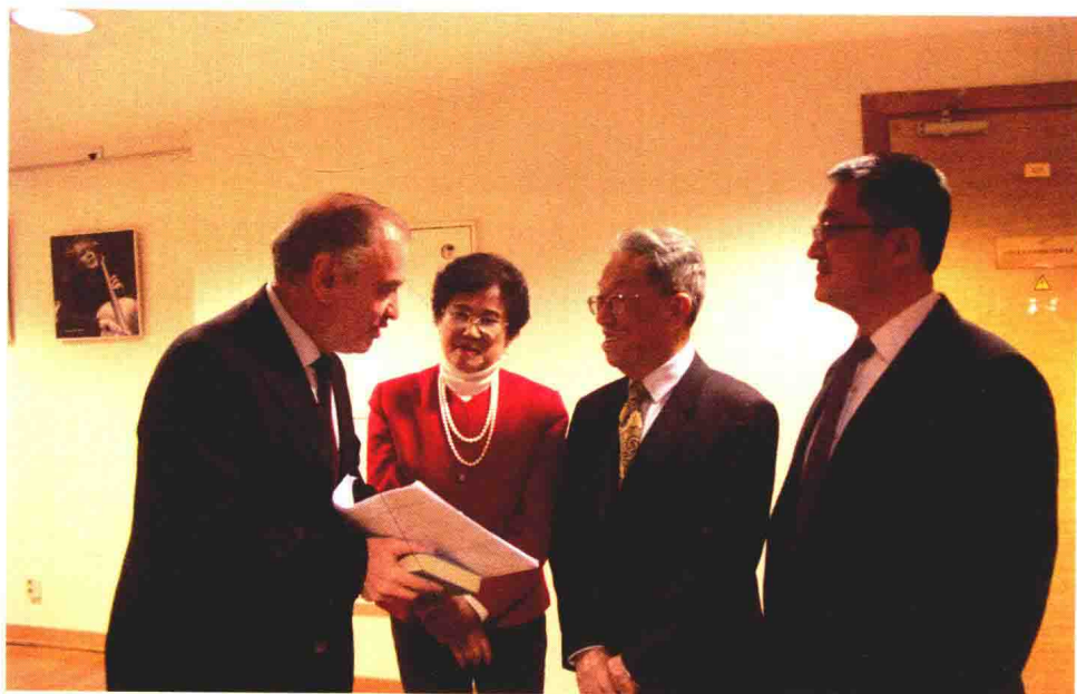
2016年12月，王蒙与马林斯基剧院艺术总监、国际指挥大师瓦莱里·捷杰耶夫（左一）亲切会面。