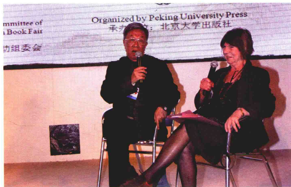
2012年4月16日，王蒙在伦敦书展中国主宾国活动中与英国作家玛格丽特·德拉布尔对谈。