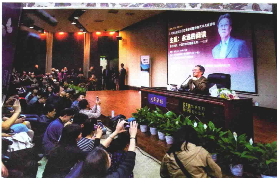
2017年4月9日，王蒙在巴蜀讲坛暨经典艺术名家讲坛作主题为“永远的阅读”的演讲。