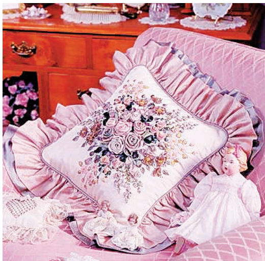
图 15-16 穆斯林国家的刺绣靠垫 凯勒赛姆和赵玉凤 / 供稿(2010年)