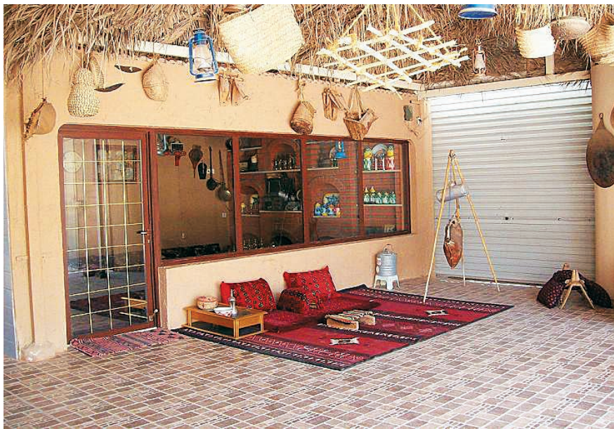
图5 穆斯林国家的家居靠垫

笔者认为,回族刺绣工艺的形成与流行,一方面,与唐宋等时期陆续来到中国的阿拉伯等国的穆斯林有一定的关系。据了解,在西域阿拉伯各国,包括海湾国家的印度、巴勒斯坦、巴基斯坦、摩洛哥等,刺绣都有着悠久的历史,而且,颇具异域风格,刺绣种类居多。尤其是女性的穿戴,无论是外面穿的黑袍,还是里面穿的长衣,都会常常装饰有刺绣图案。家居用品中,则有绣花靠背垫、枕套、壁挂和茶几条布等(见图5-图16)。值得注意的是,图19的绣品中,花卉的中心部位点缀有珍珠宝石类装饰。这一工艺手法,在宁夏早期的回族刺绣作品中也能见到,不能说它们之间没有关联性。除此之外,男性的礼拜帽,以及外面穿的大袍的领口和袖口也会有刺绣。当时,来到中国的阿拉伯等国的穆斯林势必会穿戴或带入他们本国