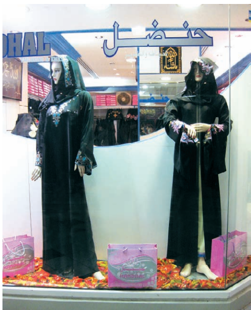
图 17 迪拜·阿拉伯女性长袍

另外, 回族刺绣的发展, 与元代大量的穆斯林进入中国也有着直接的关系。到了元代, 成吉思汗西征后, 蒙古人先后征服了阿拉伯诸国, 大批中亚和西亚各族人、波斯人和阿拉伯人随同蒙古人迁徙到中国。元代的大批回回移民中, 军人、工匠和平民的比例较高, 其中也包括西域“织金绮文工”, 他们均被编入“探马赤军”。无论是唐代还是元代的回回穆斯林, 在长期的历史发展过程中,