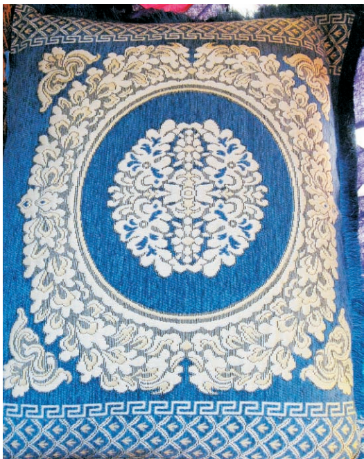
图 19 迪拜·阿拉伯靠垫(2010年)

据笔者的实地调研，在西域阿拉伯国家，果然存在有优秀的传统刺绣艺术。2010年1月，笔者曾赴阿拉伯联合酋长国的迪拜、阿布扎比、沙迦等国，考察阿拉伯民族的民间风俗习惯，包括服饰习俗，发现其穆斯林女性的传统服装——黑色长袍及居家长袍等服饰中，刺绣工艺运用得十分普遍，刺绣靠垫也是阿拉伯国家的一个特色