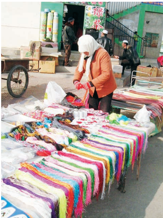
图1 出售刺绣用丝线及绣花图样的宁夏回族妇女

回族风情十分独特而浓郁,被称为“中国的穆斯林省”。宁夏各地普遍存在有回族民间刺绣艺术,至今流行不衰。特别是宁夏南部山区回族聚居的一些乡村,还广泛流布有民间刺绣,古老的刺绣手工技艺仍然为广大回族妇女所喜爱,并在不断发扬光大。图1为笔者2007年在宁夏固原山区的回族聚居区农贸市场所拍摄到的回族妇女出售刺绣用丝线及绣花图样的情景。