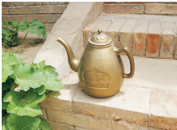
图4 宁夏固原市回族家庭所用汤瓶(2009年)