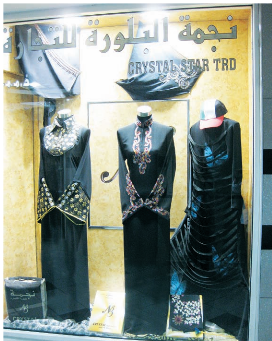
图 20-21 迪拜·阿拉伯女性长袍