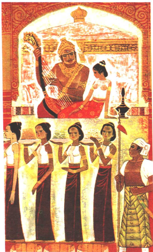
傣族《粘响》：粘响地方的公主西里罕与月亮神苏里雅底幽会