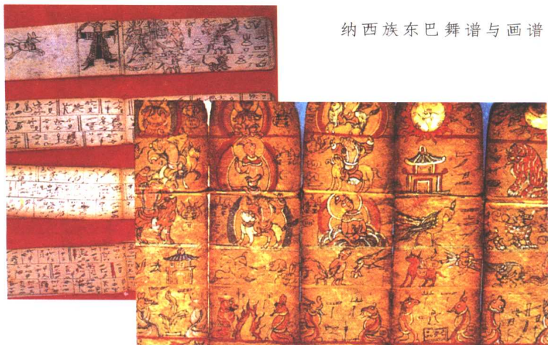
纳西族东巴舞谱与画谱